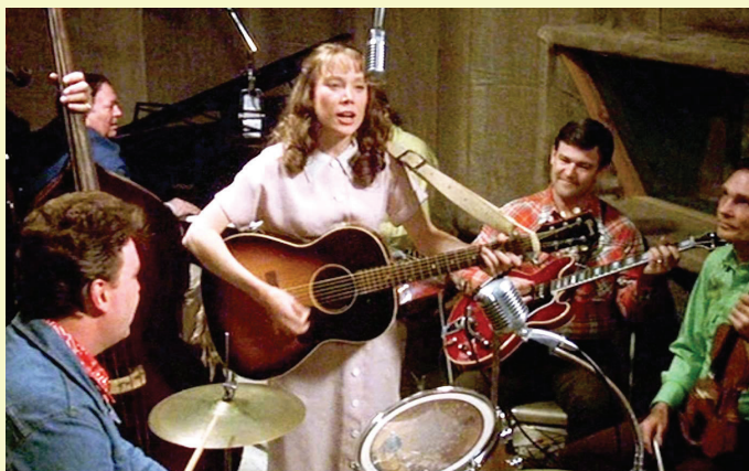
Scènes de Coal Miner's Daughter