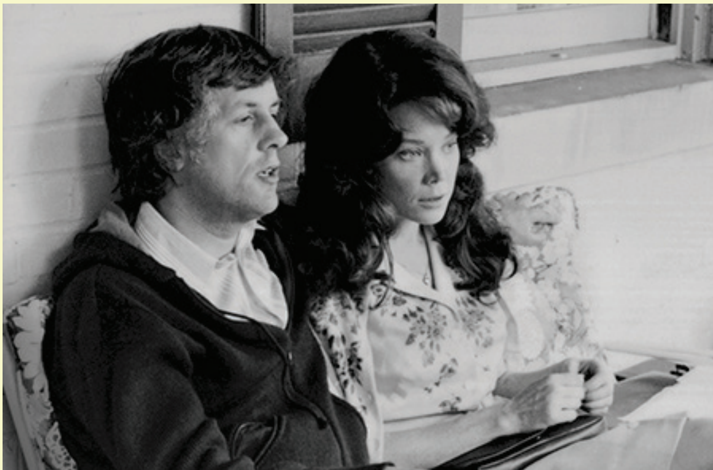
Michael Apted avec Sissy Spacek pendant le tournage du film

Les problèmes personnels de la star sont sans doute adoucis, mais ne sont pas occultés. Ils font partie d'un processus de reconstruction héroïque menant tout naturellement vers une finale rassembleuse qui, bien que prévisible, évite de sembler trop « arrangée avec le gars des vues ».