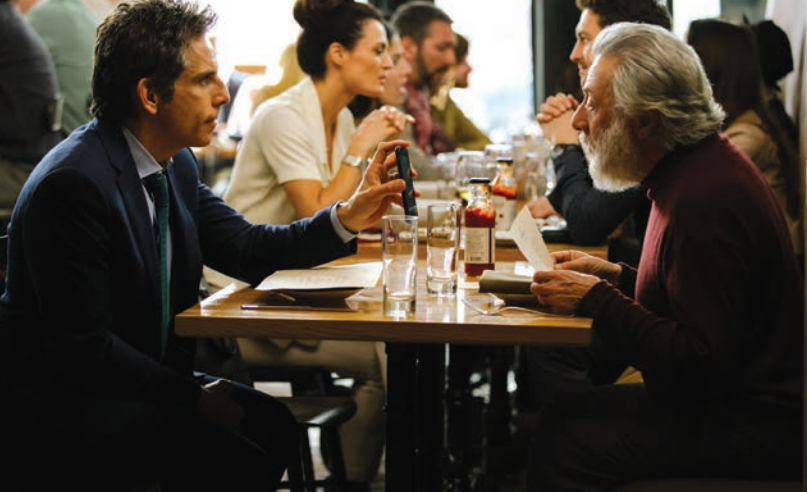
The Meyerowitz Stories

français Édouard Baer: « La vie, c'est tout ce qui se passe quand tout ce qu'on avait prévu n'a pas eu lieu. »