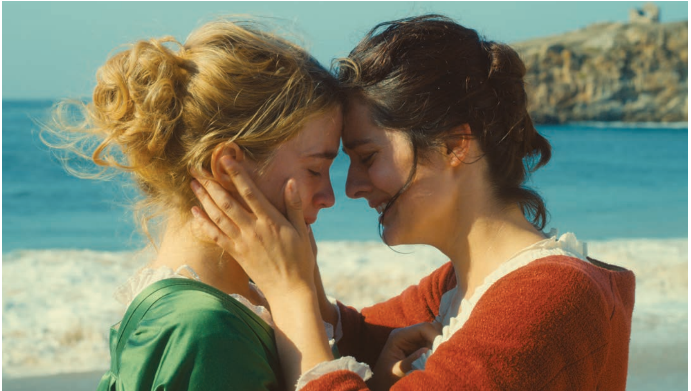
Adèle Haenel (Héloïse) et Noémie Merlant (Marianne) dans Portrait de la jeune fille en feu

c'est l'étonnement d'une apparition suprême en public de sa douce qu'elle chérit avec passion. « Elle ne m'a pas vue », conclura Marianne pendant que la caméra s'approche d'Héloïse avant de s'immobiliser sur son visage pendant plusieurs minutes. Sur l'air de l' Été de Vivaldi, qu'elle découvre, Héloïse se dévoile dans sa complexité émotionnelle, extériorisant stupeur, mélancolie et exaltation face à une autre expérience originale, celle d'un orchestre entendu pour la première fois. Devant la résurrection de sentiments la ramenant à un doux moment partagé avec celle qui a laissé une empreinte impérissable dans son esprit, la jeune femme doit le concéder : « Ce n'est peut-être pas joyeux, mais c'est vivant. »