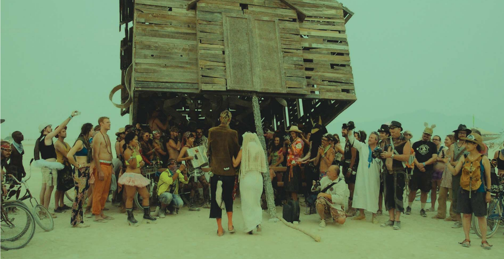
Scène singulière comme seul peut en offrir Burning Man.

qu'elle avait découvert... par le biais d'un ami cinéaste danois! Il avait fait une trame sonore pour un autre film et j'ai écouté son travail. J'avais le sentiment qu'il pourrait composer cette qualité éphémère et magique que je voulais donner à Gift . Je l'ai trouvé ouvert, à l'écoute. C'était une belle collaboration! J'ai aussi eu la chance de travailler avec Sylvain Bellemare pour la conception sonore. On a eu beaucoup de plaisir, à la fin du processus, à créer une atmosphère un peu ludique et magique, qui ajoutait un autre niveau au montage.