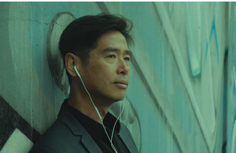
Le fascinant Lee Mingwei, dont le « travail brouille les frontières entre l'art et la vie ».

ceux qui ne connaissent pas Hyde. Il n'est pas du tout nécessaire d'avoir lu The Gift pour apprécier ou comprendre mon film, mais je trouvais que ça lui apportait une dimension intéressante. Au montage, on s'est interrogées sur le nombre de citations à utiliser, si l'on allait s'en servir pour marquer des chapitres dans le film... J'ai organisé des visionnements et les opinions variaient beaucoup! Au final, je trouve que ça fait ressortir le côté poétique des histoires des personnages.