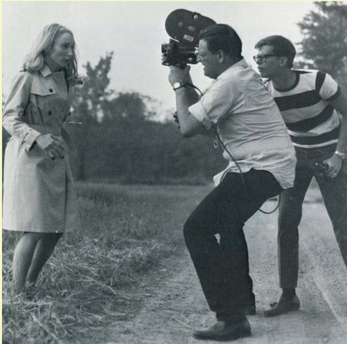
George A. Romero lors du tournage de Night of the Living Dead

Barbra découvre le cadavre dévoré de la propriétaire des lieux. Ce face à face avec la brutalité funeste et la menace réelle que représente le zombie entraînent une cassure chez le personnage qui sombre dans une panique incontrôlable et tente de prendre la fuite. C'est à ce moment que Ben entre en action. Le spectateur le voit du point de vue de Barbra; d'abord aveuglée par les phares de la voiture de Ben, elle aperçoit soudainement le visage de celui qui veillera sur elle: le visage d'un homme afro-américain.