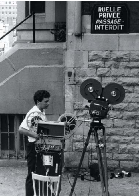
Claude Jutra tournant À tout prendre

Ces révélations sont englobées dans un chapitre intitulé « Les amours de Jutra ». « Jutra et les garçons », ce n'est pas un chapitre, c'est une section dans un chapitre. Et tout cela fait partie d'un ensemble. J'aurais pensé que les gens, avant de faire une grosse affaire avec ça, liraient le livre, tout le livre. Puis, qu'ils diraient: « Bon... il y a eu ça aussi. » Trente ans après la mort de quelqu'un, on peut dire qu'il y a eu une zone sombre dans sa vie. J'imaginai, mais je réalise que je suis trompé, que ce ne serait pas une si grosse bombe. Quand je dis que je n'aurais pas écrit le même livre en 1990, c'est d'abord parce que les gens ne m'auraient pas parlé de cet aspect de sa vie. Et s'ils l'avaient fait, peut-être que l'on m'aurait dit: « On n'écrit pas de livre maintenant, sa mort est trop récente, ça ne serait pas approprié d'en parler... ». Cela dit, les gens qui ont témoigné à ce jour racontent des événements qui se sont déroulés il y a très longtemps,