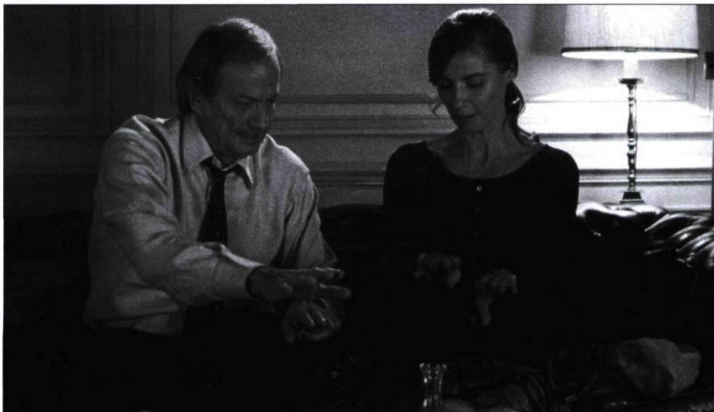
Patrick Chesnais et Anne Consigny dans Je ne suis pas là pour être aimé