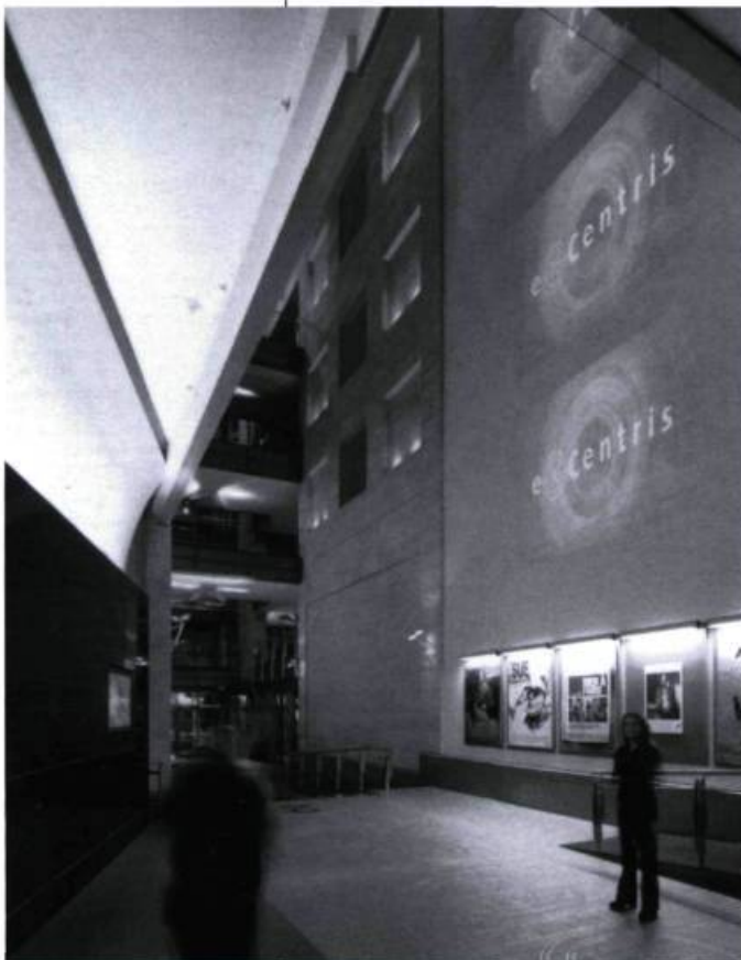
C'est souvent à l'Ex-Centris que les choses commencent... Ici, le hall d'entrée

L es mégaplexes poussent comme des champignons, multipliant les écrans et les séances. Et le cinéma commercial, assoiffé, gourmand, accapare de plus en plus de terrain. Avec toute cette occupation, quelle place reste-t-il pour le cinéma d'auteur? On parle souvent de la diffusion avec des chiffres: pourquoi ne pas parler cette fois des lieux et des gens, question de voir les efforts déployés et les difficultés de parcours?