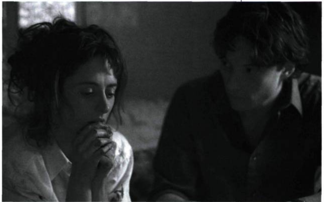
Crème glacée, chocolat et autres consolations, une des belles surprises québécoises de l'année 2001