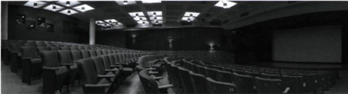
La salle où se déroulent les activités de CinémAlice à Matane