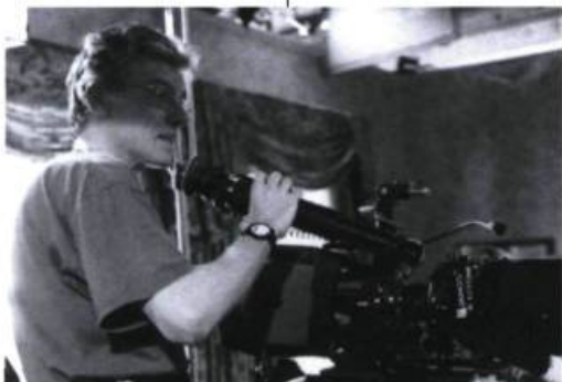
Selon Bernard Émond, «ce genre de rencontre [lui] apporte plus que n'importe quel festival étranger.»

le pilote des séances. De sa cabine surplombant la salle, il prend son micro et souhaite la bienvenue aux invités, annonce la présentation d'un court métrage, le film de la prochaine semaine ou la présence d'un invité.