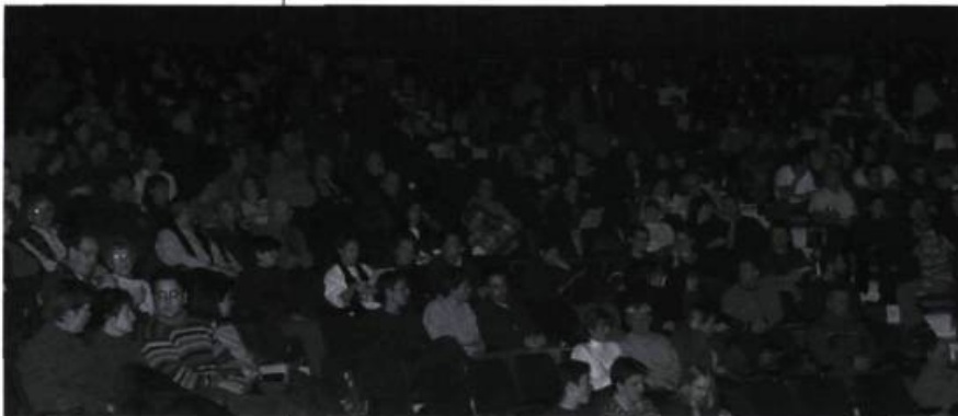
«À Chicoutimi, ce sont les lundis soir qui sont consacrés au cinéma d'auteur. Et toute la ville le sait.»