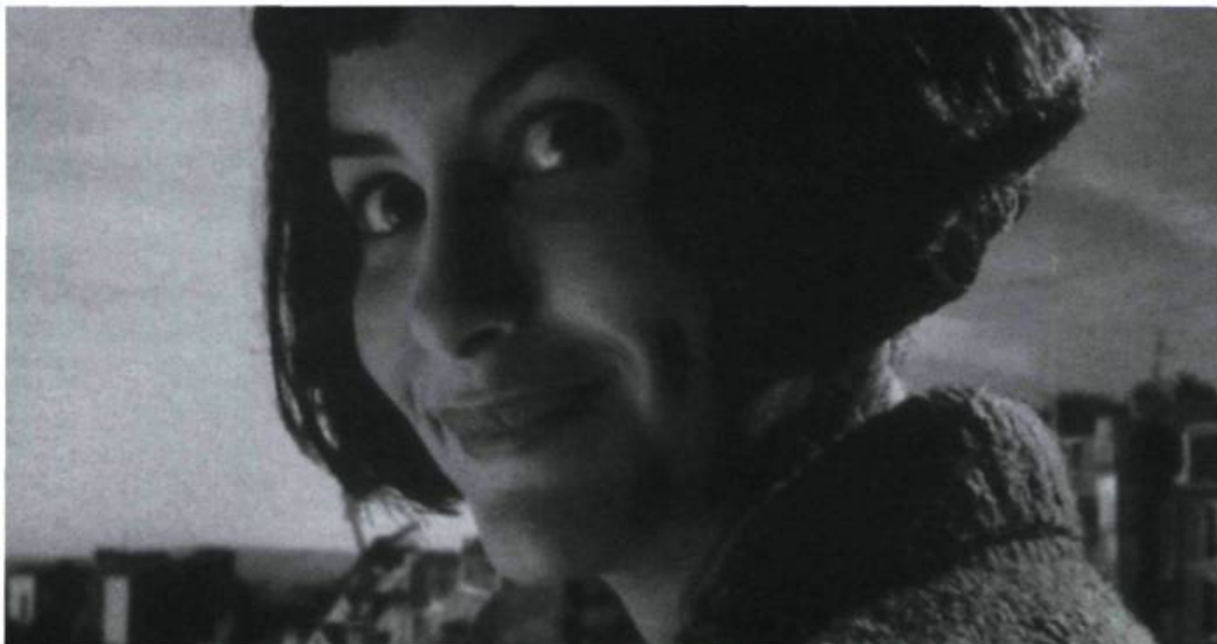
Le Fabuleux Destin d'Amélie Poulain , même en reprise dans plusieurs salles, a fracassé des records

Il semble bien que l'on se trouve devant un problème de politique culturelle. Il faudra voir ce qu'en fera la prochaine mouture de la Loi sur le cinéma. Histoire à suivre. ■