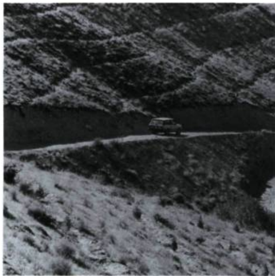
Le Goût de la cerise de Abbas Kiarostami

Même s'il apparaît clair que Kiarostami a subi la forte influence des maîtres de l'école néoréaliste italienne (les De Sica, Rossellini, Visconti et autres),