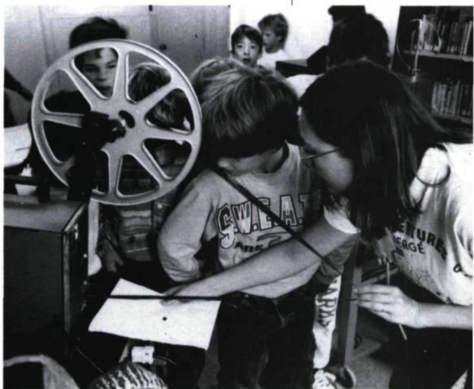
Ateliers d'initiation au cinéma, Carrousel international du film de Rimouski