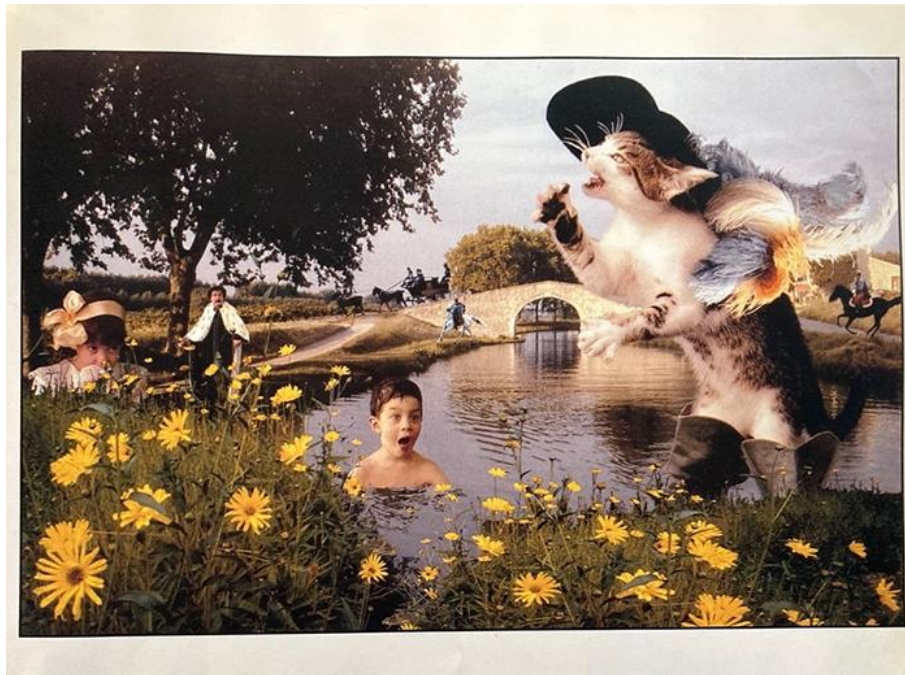
Frank Horvat et Véronique Aubry, Yao le chat botté (1992)

Photomontage tiré de Frank Horvat et Véronique Aubry, Yao le chat botté , Paris: Hachette/Gautier-Languereau, 1992, n.p.