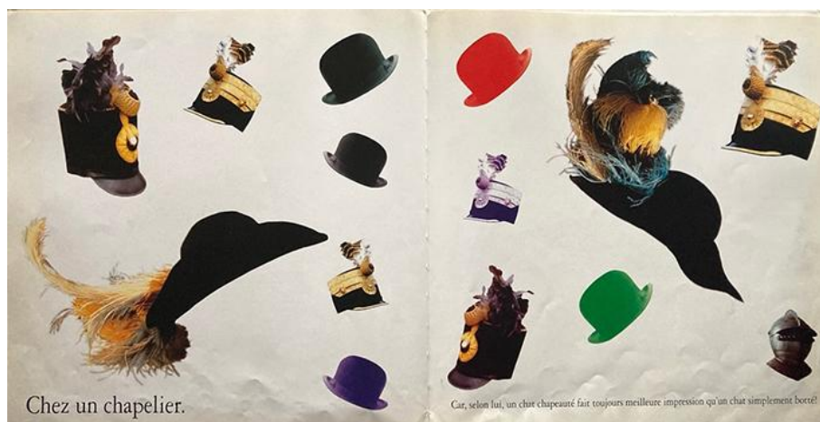
Frank Horvat et Véronique Aubry, Yao le chat botté (1992)

Pages tirées de Frank Horvat et Véronique Aubry, Yao le chat botté , Paris: Hachette/Gautier-Languereau, 1992, n.p.