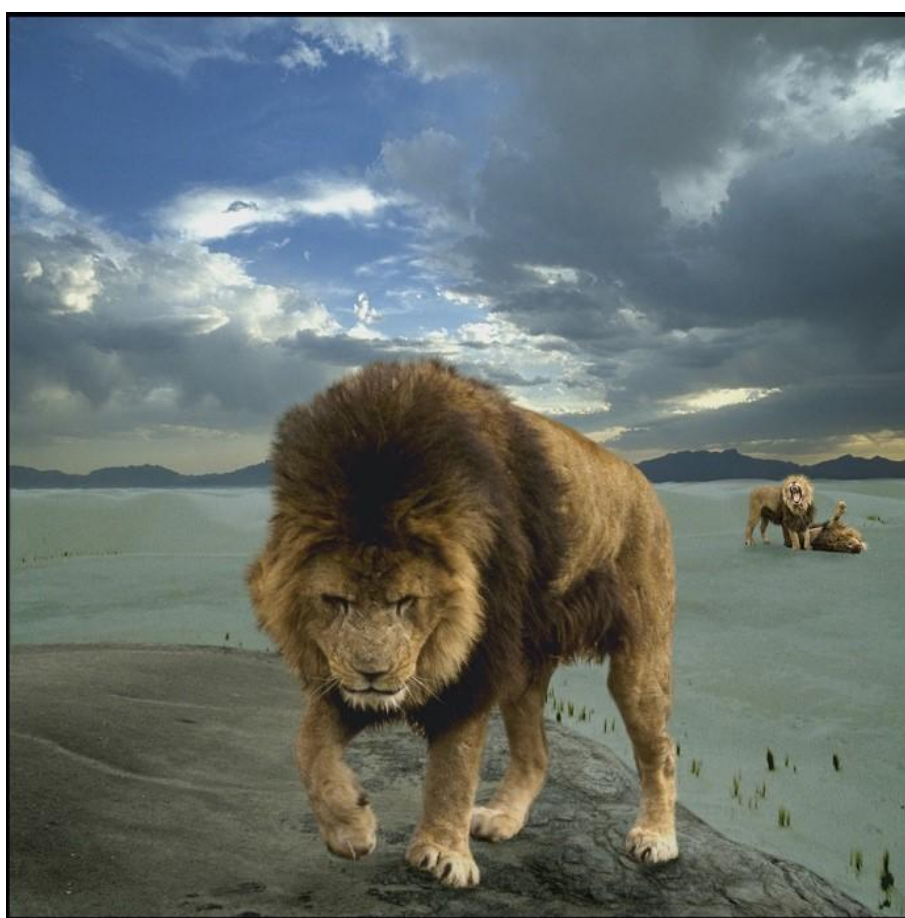
Frank Horvat, Lion (1994)

Oeuvre tirée de la série Le bestiaire d'Horvat