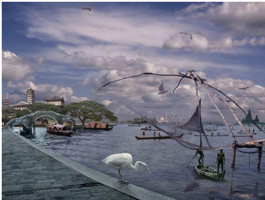
Frank Horvat, Agora (1992)

Oeuvre présentée lors de l'exposition L'épreuve numérique , Palais de Tokyo du 6 novembre 1992 au 18 janvier 1993.