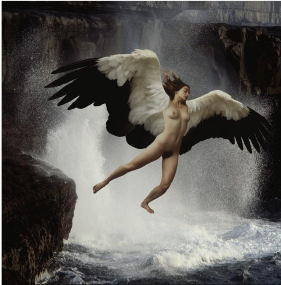
Frank Horvat, Alcyone (1996)