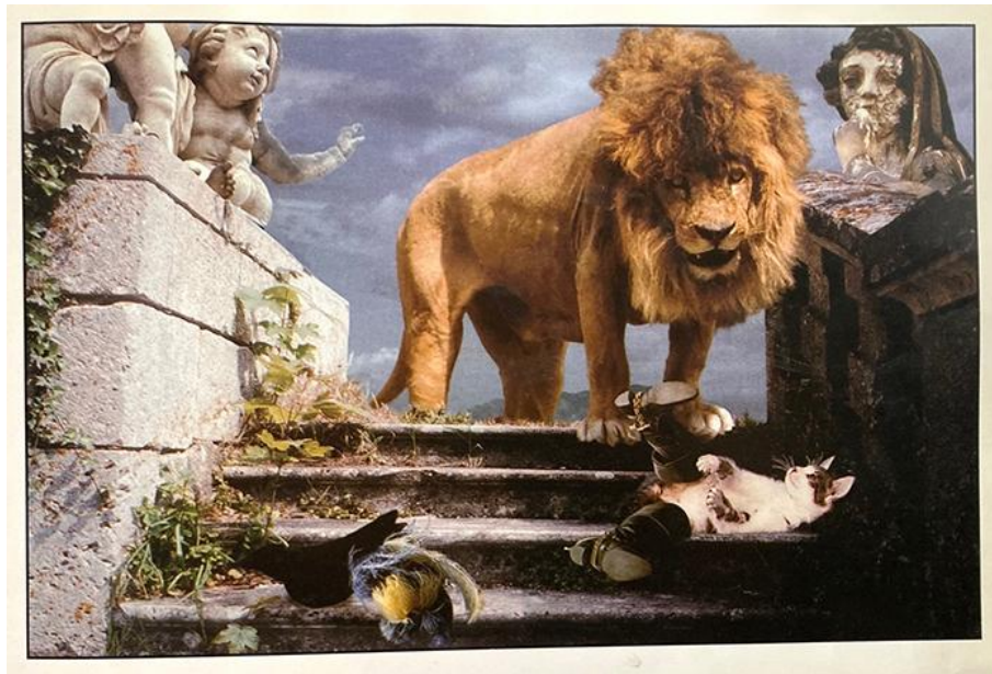
Frank Horvat et Véronique Aubry, Yao le chat botté (1992)

Photomontage tiré de Frank Horvat et Véronique Aubry, Yao le chat botté , Paris: Hachette/Gautier-Languereau, 1992, n.p.