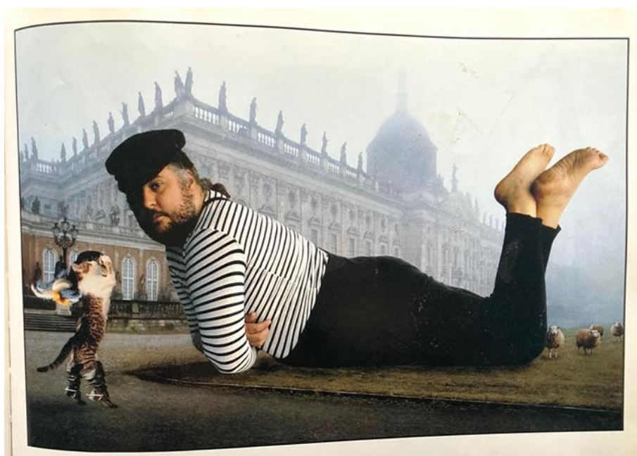
Frank Horvat et Véronique Aubry, Yao le chat botté (1992)

Pages tirées de Frank Horvat et Véronique Aubry, Yao le chat botté , Paris: Hachette/Gautier-Languereau, 1992, n.p.