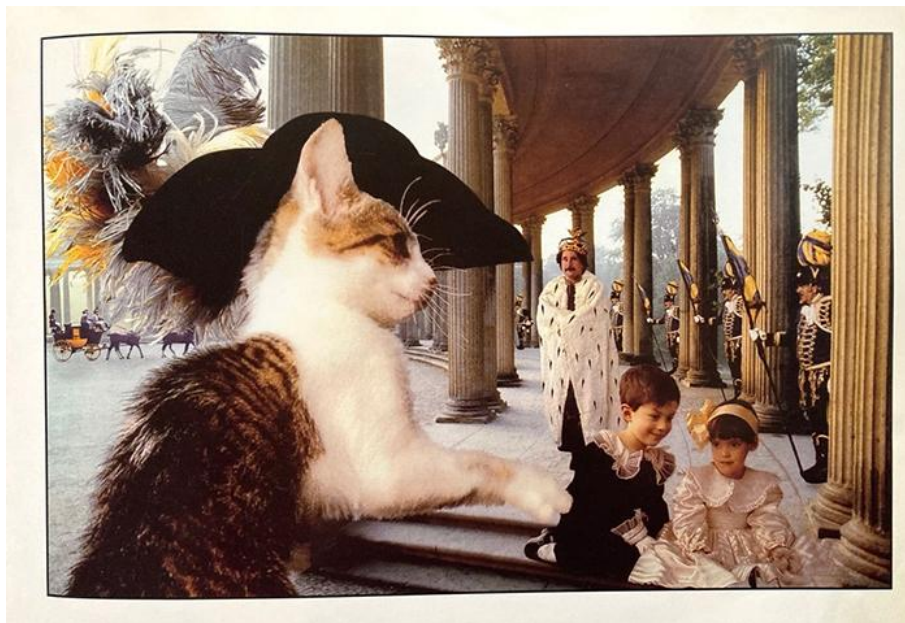
Frank Horvat et Véronique Aubry, Yao le chat botté (1992)

Photomontage tiré de Frank Horvat et Véronique Aubry, Yao le chat botté , Paris: Hachette/Gautier-Languereau, 1992, n.p.