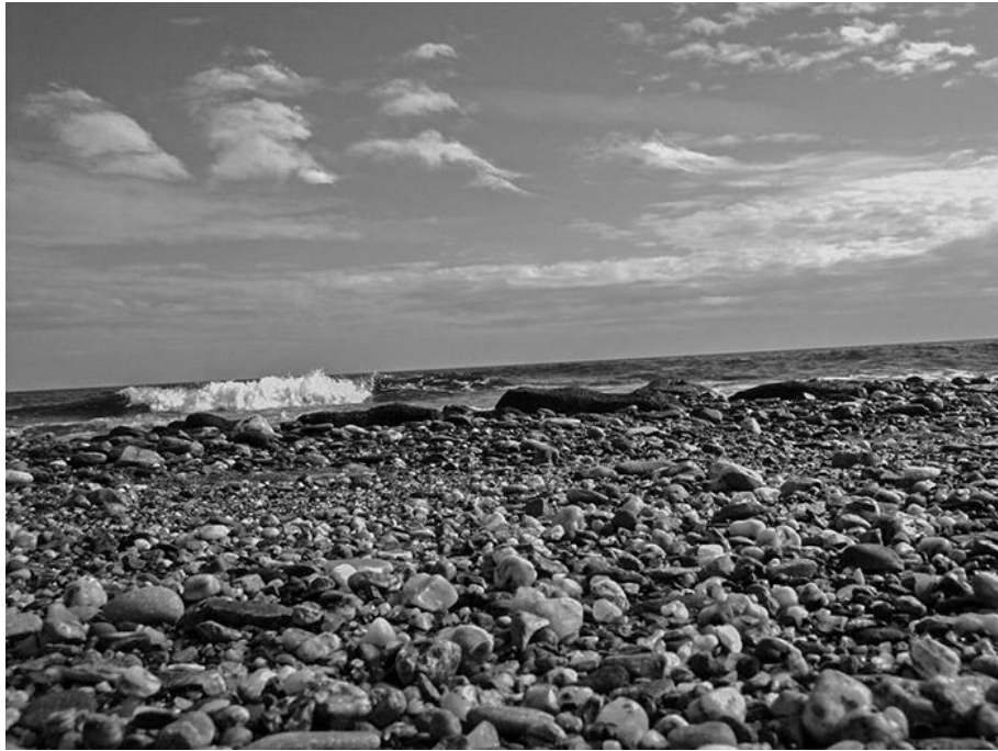
Clemente Bernad, Sans titre (2004)

Personne et photographe vont dans la même direction, en parallèle. Dans les deux cas, je doute beaucoup, parce que j'aime ça. Je suis curieux. Le doute me conduit à adopter une attitude de scepticisme, presque militante. Quelque chose peut m'intéresser énormément mais immédiatement je vais commencer à le mettre en question. En matière de photographie, je fuis la facilité et je finis par tomber dans des histoires complexes et ambiguës, qui demandent beaucoup d'efforts mais qui procurent une satisfaction professionnelle 6 .