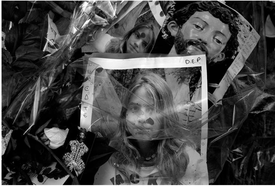
Clemente Bernad, Sans titre (2009)

Photographie tirée de Patxi Irurzun et Clemente Bernad, Caperucita roja , Madrid: Alkibla, « Te Cuento », vol. 1, 2014