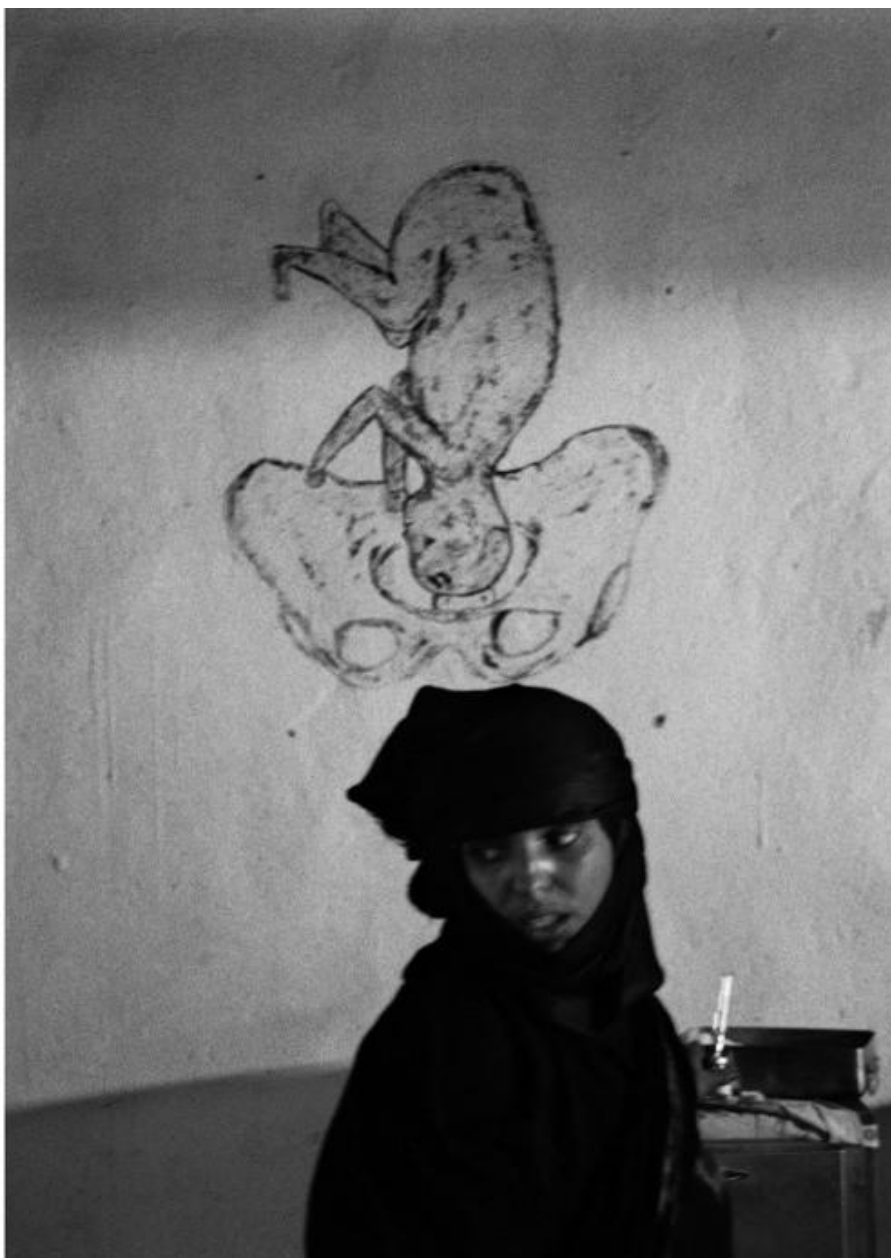
Clemente Bernad, Sans titre (1998)

Photographie tirée de Marta Sanz et Clemente Bernad, Blancanieve , Madrid: Alkibla, « Te Cuento », vol. 3, 2014