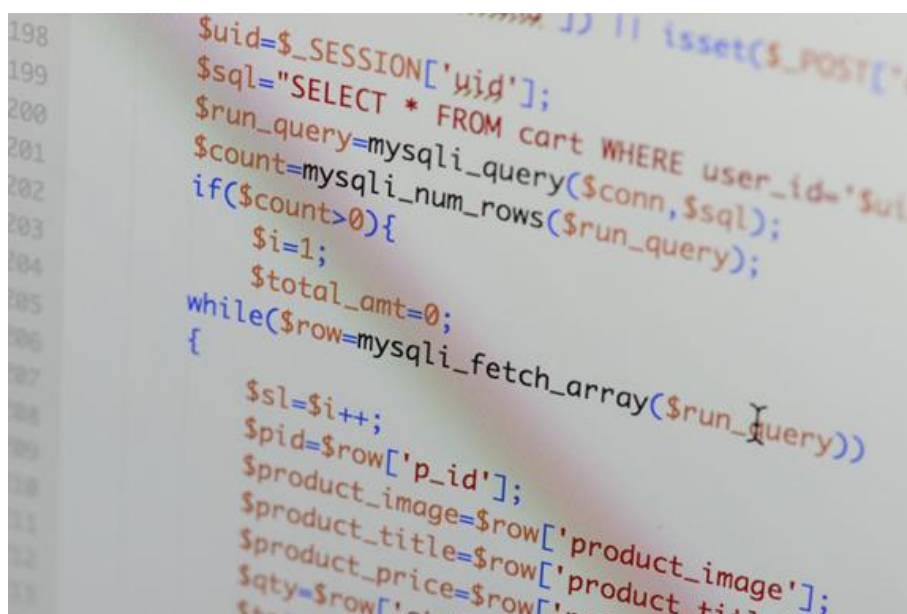
Piotrkt, Lignes de code PHP visibles (s.d.), Photographie numérique | 2507 × 1673 px

Par cette faculté de produire une représentation décalée du monde, neuve et rassérénante pour les personnages, le numérique offre une métaphore ou une figure réflexive de la création littéraire. Il comprend comme elle une forme de langage, une écriture, parfois de longue haleine, comme l'est la production du système logiciel régissant le conteneur, travail de création qui « totaliserait quinze millions de lignes de codes, dont plusieurs dizaines de milliers écrites sur mesure » (264).