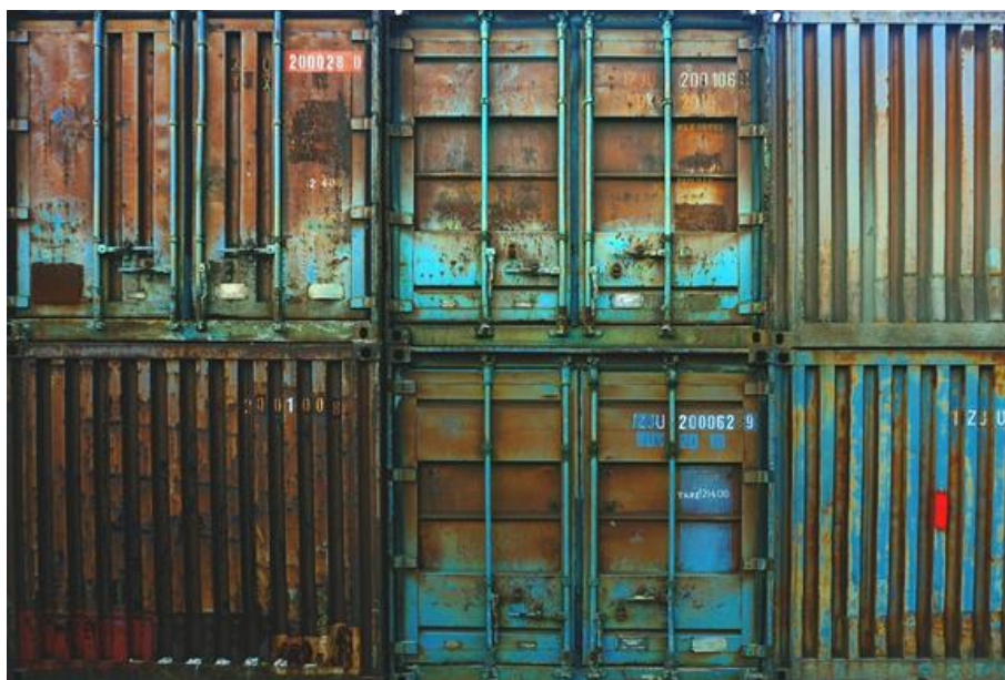
Anonyme, Conteneurs de stockage (2016), Photographie numérique | 1920 × 1280 px

liberté en décrivant un conteneur comme « un énorme biscuit chinois » (2015: 84), soit un objet cryptique, le véhicule d'un message, une forme de média. En effet, le conteneur est un pur contenant, un réceptacle dont l'apparence standardisée peut receler n'importe quelle secrète cargaison, voire une passagère clandestine réalisant un voyage initiatique autour du globe, à l'instar de Lisa. Notons qu'à titre de symboles, les objets sont aussi potentiellement des signes autoréflexifs de l'entreprise littéraire, c'est-à-dire qu'ils peuvent jouer pour le romancier, comme pour ses personnages, le rôle de repère identitaire. On trouve ainsi des objets constituant des mises en abyme de l'oeuvre romanesque, tel le « livre à trois têtes » dans Nikolski (2005: 175), formé de la reliure de trois ouvrages à l'instar du roman qui tisse les destins de trois personnages, Noah, Joyce et le narrateur 3 .