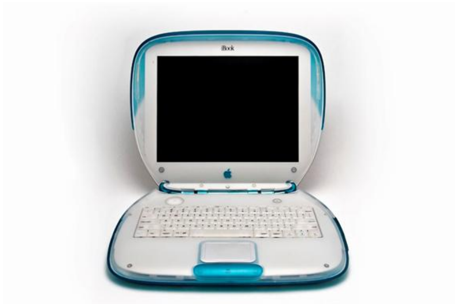
Carl Berkeley, iBook G3 466 MHz Blue/White Clamshell (2009), Photographie numérique | 2048 × 1365 px

Flickr ( https://www.flickr.com/photos/mac_users_guide/with/4052389716/ )