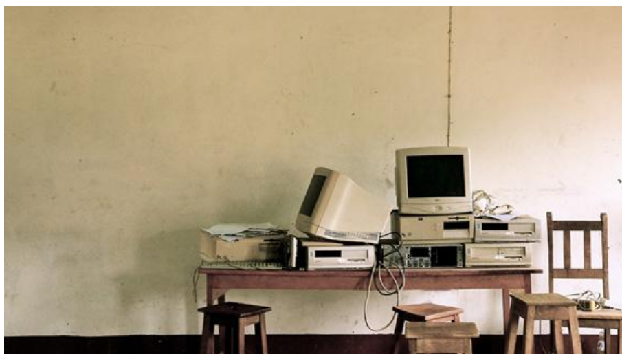
Ludi, Matériel informatique (2015), Photographie numérique | 1920 × 1079 px

Six degrés de liberté , dont l'intrigue se situe entre 2005 et 2012, prolonge cette vision prophétique en se présentant comme le roman des réseaux et des systèmes interconnectés, d'un espace virtuel dans lequel on voyage à bord d'un conteneur intelligent. Pourtant, le roman intègre une foule d'objets qui font surgir un archaïsme technique, tels une montgolfière portant le logo RE/MAX (2015: 60-61), une automobile Datsun (32), un radio-réveil (54), un exemplaire imprimé des Pages jaunes (89), de vieux numéros du magazine Lundi (9). Ces divers objets techniques (dont les objets numériques) introduisent dans l'univers romanesque la trace du temps historique qu'ils incarnent, celui de leur fabrication, de leur première apparition, de leur usage (parfois dépassé — d'où leur archaïsme). Ils jouent un rôle de datation de l'intrigue, mais aussi de représentation de l'épaisseur du temps, de la mémoire technique de la société. L'imaginaire numérique chez Dickner est par là fortement lié à l'imaginaire temporel. La culture numérique n'y est pas pur signe du temps présent : elle possède déjà une profondeur historique.