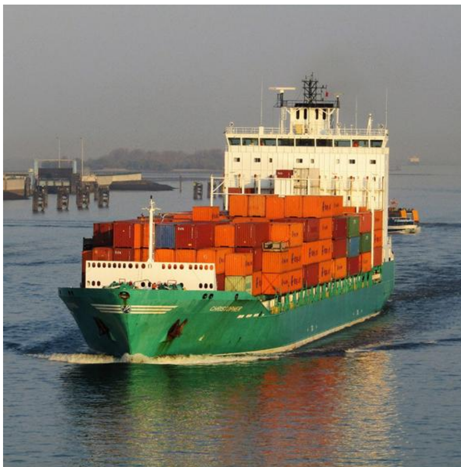
Anonyme, Le Christopher et ses conteneurs sur une rivière (s.d.), Photographie numérique | 3864 × 3864 px