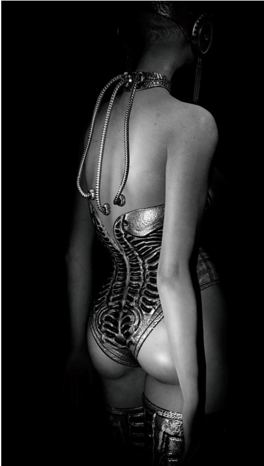
Anouk A., You'll Scream (2019), Photographie virtuelle d'un avatar de Second Life ( https://secondlife.com/ ), Image numérique | 2500 x 4400 px

©Karoline Georges ( https://www.karolinegeorges.com/ )