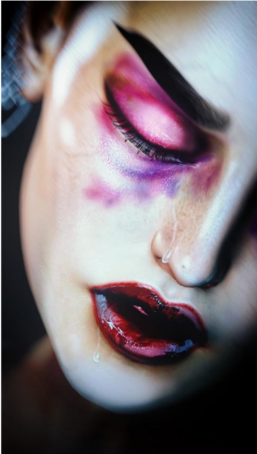
Anouk A., Some More Pain (2019), Photographie virtuelle d'un avatar de Second Life ( https://secondlife.com/ ), Image numérique | 2500 x 4400 px