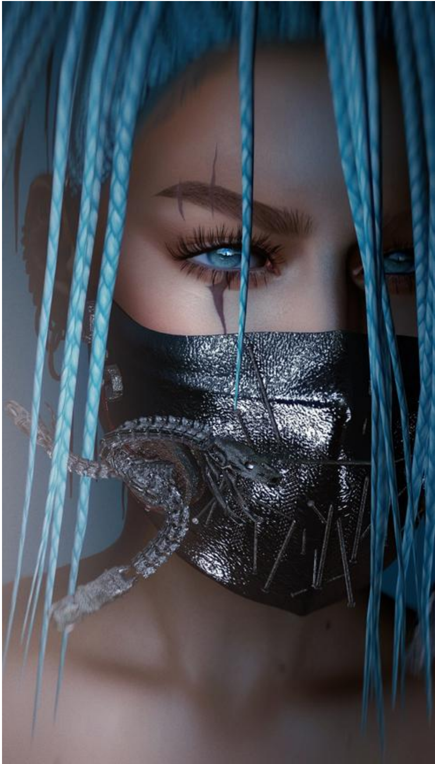
Anouk A., My Own Private Cage (2019), Photographie virtuelle d'un avatar de Second Life ( https://secondlife.com/ ), Image numérique | 2500 x 4400 px

©Karoline Georges ( https://www.karolinegeorges.com/ )