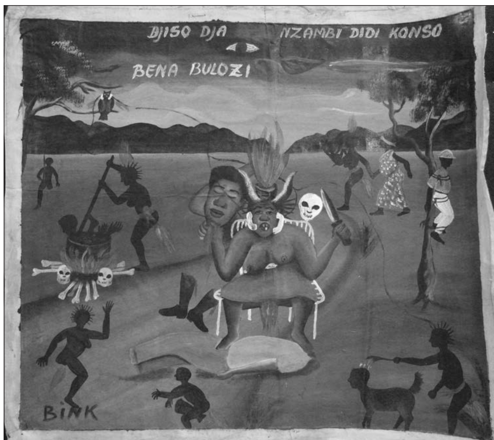
Figure 9: «Bena Bulozzi» (Sorcières), Bink, Lubumbashi, n.d., Collection MRAC Tervuren Fonds B. Jewsiewicki, n° 633

Dans la société congolaise, une femme adulte qui expose son sexe en public, laissant tomber le pagne, lance la plus violente malédiction à l'homme à qui ce geste s'adresse 34 . Les représentations picturales de la sorcellerie font jaillir les flammes de l'enfer des vagins de vieilles femmes (fig. 9). Dans le monde social des Congolais, le vagin est un lieu d'où vient la vie biologique et sociale, mais aussi celui où, une fois la procréation éteinte, résident les forces les plus dangereuses que l'humain puisse manipuler. Pour punir/exorciser les femmes suspectées de sorcellerie, on leur passait du feu entre les jambes.