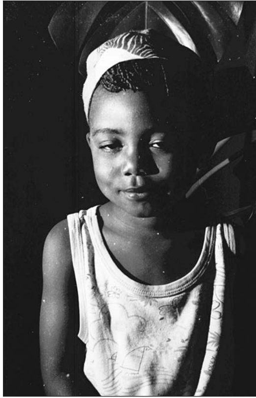
Figure 1: Sans titre, Simon Mukunday, Lubumbashi, n.d.

années 1920, les Congolais y occupent des emplois industriels qualifiés. Avant la crise de la désindustrialisation qui a frappé la région en 1990, une troisième génération d'ouvriers nés et formés sur place entrait sur le marché du travail. Africaine, Lubumbashi est une ville ouvrière, industrielle, moderne aux yeux de ses habitants. Ils ont fait face à des problèmes similaires à ceux d'ailleurs dans le monde lorsque l'industrialisation et la commodification ont transformé les relations sociales, lorsque le salaire a rendu l'individu autonome de l'économie d'un groupe, et lorsque cet individu a disposé de nouvelles technologies de la représentation du soi. Les gens et leurs pratiques n'ignorent pas pour autant les cultures de leur groupe ethnique d'origine, dont la mémoire culturelle se combine actuellement avec un ou des évangélismes et avec une culture de la globalisation, celle véhiculée sur l'Internet. Autour d'un noyau commun, les champs d'expérience varient dans l'espace social, et dans la durée, être moderne est l'horizon d'attente de tous.