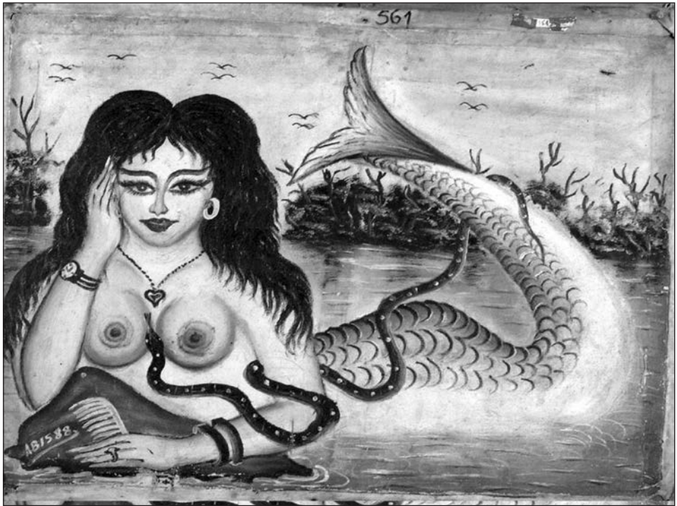
Figure 3 : Sirène, Abis, Lubumbashi, 1988, Collection MRAC Tervuren Fonds B. Jewsiewicki, n° 131

à bas prix. Non seulement ils sont partout et toujours disponibles, mais leurs prix sont très bas même si les épreuves sont en couleur. Avec eux, la fabrication de la photographie se fait désormais dans la rue. Le décor, l'habillement sont à la charge du client, souvent « empruntés » dans le monde ambiant. Une pose à côté d'une voiture temporairement en arrêt, une paire de lunettes, une paire d'espadrilles empruntées, etc. Chacun et chacune, écoliers compris, peut s'offrir une photographie en raison de la brusque démocratisation du médium. Il ne faut pas en conclure qu'il n'y a plus de codes éthiques et esthétiques la régissant, bien au contraire. Mais, en absence de photographe professionnel les appliquant, c'est la réception qui les impose 18 . La photographie continue d'assurer, sinon la présence, au moins une promesse de présence de la personne moderne dans l'espace-temps dont la modernité s'effrite. Elle ne circule plus tellement de la ville vers le village, mais plutôt à l'intérieur des espaces urbains.