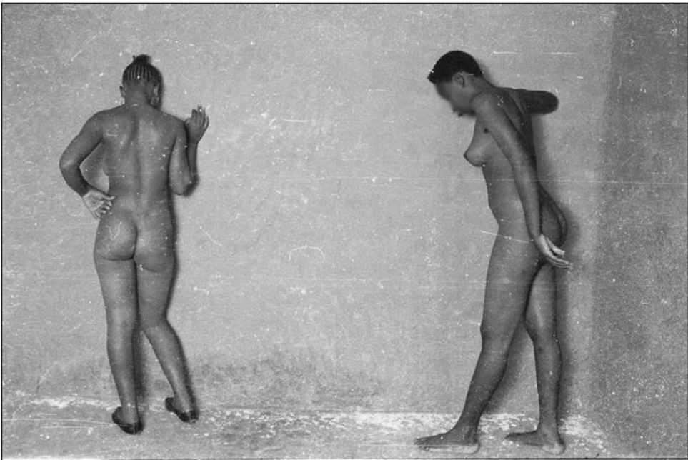
Figure 7 : sans titre, Simon Mukunday, Lubumbashi, n.d.

Quelques maisons pouvant appartenir à la classe moyenne prêtent leur intérieur à la prise de ces photos. La vétusté de la plupart de ces maisons, ainsi que l'usure de l'ameublement et ce qui peut apparaître comme de la malpropreté, frappent le spectateur occidental habitué dans la photographie érotique et pornographique à des décors léchés. On pourrait dire qu'en Occident le désir est vendu entier, ce qui n'est pas le cas ici. Plus de la moitié des photos ont été prises dans une même pièce avec un tapis usé couvrant le sol. Il est probable que cette pièce faisait partie de l'habitation du photographe. Certains intérieurs semblent inhabités, comme abandonnés ; parfois des objets ou vêtements traînent à terre ou sur un meuble. Sur un cliché, le modèle à moitié nu a la tête enfouie dans une blouse qu'elle enlève ; autour il y a assez de vêtements abandonnés pour remplir une valise, trop pour suggérer qu'elle se déshabille pour le spectateur. Probablement involontairement, la prise de vue donne l'impression que la femme lutte avec elle-même pour retrouver son corps nu.