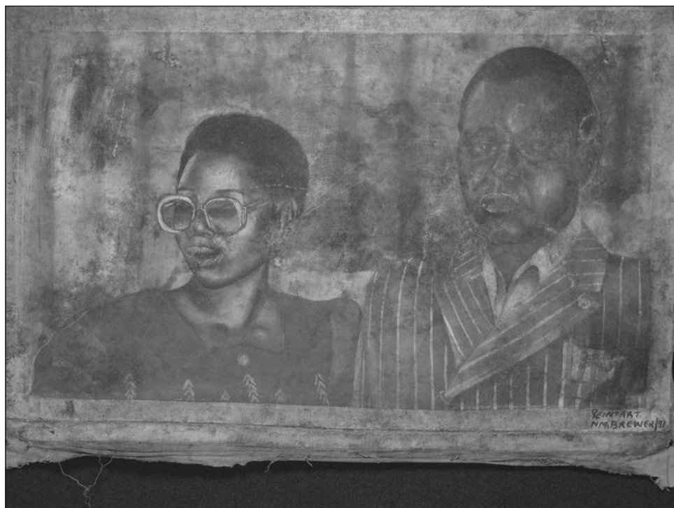
Figure 2: Portrait d'un couple, Peintart, Lubumbashi, 1991, Collection MRAC Tervuren Fonds B. Jewsiewicki, no 973

centrale (devenue au début du siècle passé colonie belge puis, en 1960, État indépendant), la photographie, et plus généralement l'image bidimensionnelle analogique, se constituent en interface de la modernité. La photographie circonscrit l'individu dans un espace-temps qu'on dirait aujourd'hui virtuel, au sens de la capacité de coexister avec l'espace-temps ordinaire du village. L'image « moderne » lui permet de donner une présence à sa personne « moderne » sans remettre en question ses qualités sociales de membre d'un groupe. Deux espaces temps coexistent en surimposition, chacun permettant de tenir un discours sur les rapports sociaux au sein de l'autre. À la fin du XIX e siècle, les premières photographies sont prises et vues par leurs sujets congolais. Vers le milieu du XX e siècle, les Congolais maîtrisent non seulement la technologie, mais aussi l'économie de la photographie. Pendant ce demi-siècle, l'image photographique confère de la présence à la face « moderne » de l'individu, à sa personne « moderne », sans que cet individu ne quitte ses réseaux d'appartenance.