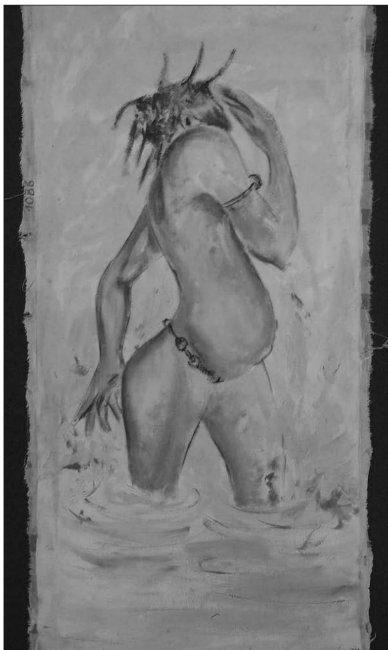
Figure 8 : Femme nue portant la ceinture jikita, anonyme, Lubumbashi, Collection MRAC Tervuren, Fonds B. Jewsiewicki, n° 957