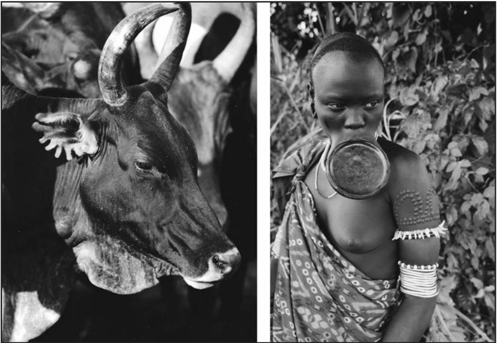
Photographie 2 : une vache avec les cornes chipto (noué) et une jeune femme portant son labret. On remarque aussi le parallèle graphique entre les scarifications des oreilles du bovin ( niava kono ) et les scarifications ( kichoa ) sur le bras.

L'une de ces formes intermédiaires entre humains et bovins est particulièrement saillante dans l'espace visuel du quotidien. Les femmes Mursi portent un labret. Il s'agit d'un disque d'argile, parfois de bois, inséré dans la lèvre inférieure et porté de la puberté à la maturité lors des moments où la présentation de soi est une condition importante de l'interaction : recevoir des hôtes, participer à des cérémonies, etc. (LaTosky 2006). Outre la modification de la gestuelle corporelle et l'exhibition d'une scarification lorsque le labret est déposé (Eczet 2012), le labret modifie le visage et ses proportions. En parallèle, les bovins voient leurs cornes modifiées, qui poussent en différentes orientations. La plus fréquente, nommée chipto (noué), consiste à recourber les cornes au-dessus du crâne afin