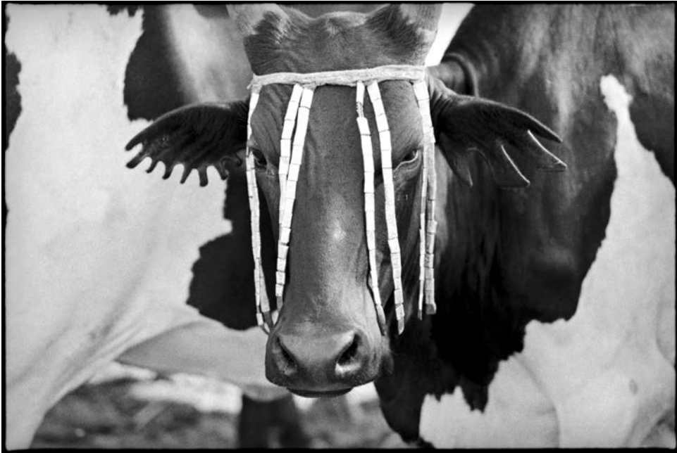
Photographie 3 : bœuf à la couleur de son propriétaire. On peut y voir un ornement de tête ( karum ) et deux coupes d'oreilles différentes reprenant les deux types de scarifications des personnes. Photo : Jean-Baptiste Eczet (2008)

l'état général en employant ce même terme. Le malade se tient dans sa hutte, dérobé aux regards, et tout au plus lui parle-t-on de l'extérieur de sa hutte. Ainsi, le ree malade, qu'il soit couleur ou corps, ne peut avoir lieu (c'est à dire se tenir devant les autres) s'il est diminué dans ses capacités interactionnelles : plus de corps, plus de noms. Un état de faiblesse entraîne la suspension du processus afférant au ree , en interrompant la vue du corps et l'usage de déclinaisons colorées présentes dans les noms. Le ree ne désigne que le corps vivant, c'est un intensif que la maladie vient diminuer et que la mort vient anéantir. D'ailleurs, on ne peut pas employer ce terme pour désigner un cadavre. Et lorsqu'il désigne la couleur des personnes, le ree est également mentionné sous sa forme verbale ( reg'e ), lors de l'usage d'une couleur dans un poème par exemple.