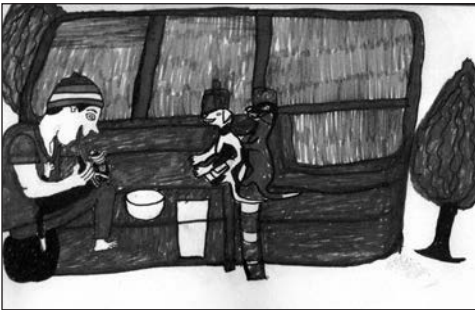
Dessin 3: bouillie

Au commencement « On leur donne de la bouillie de mil ou de maïs. On paye aussi des arachides », est-il précisé. Dans le dessin 3, un homme, comme dans la description de Labouret, souffle de la nourriture dans la gueule du chiot en le tenant dans ses bras sous le regard de deux autres de ses « frères » qui se sont installés sur le toit-terrasse de leur maison. Puis, lorsque les chiots grandissent, l'homme délaye du gâteau de mil ( tô ) et en verse dans une écuelle qui leur est réservée qui n'est autre qu'un tronc d'arbre évidé (dessin 4).