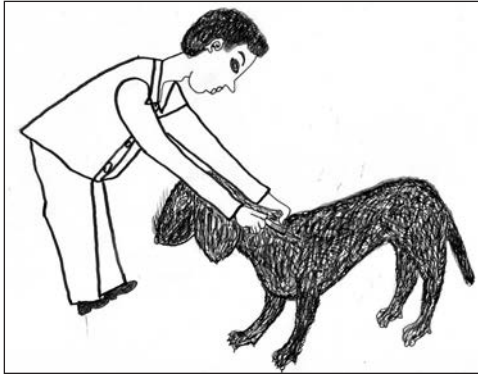
Dessin 9: chien vacciné