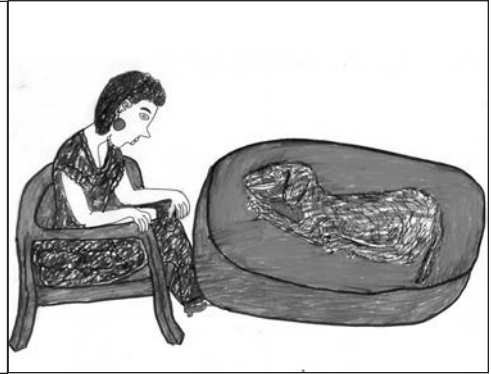
Dessin 10: « Comme il est joli »

en laisse son chien ne relève pas de l'ordinaire en Afrique, même en univers urbain (Singleton 1998), l'usage de colliers destinés à certains chiens du pays lobi avait déjà été remarqué dans la région au début du siècle passé. « L'amour des propriétaires se traduit encore par le soin avec lequel sont confectionnés les colliers et les sonnettes que portent quelquefois ceux-ci » (Labouret 1931 : 125).