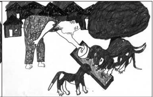
Dessin 4: tô

On pourrait ici parler d'une sorte de « paternage » alimentaire. Il s'agit d'une activité uniquement masculine. Diniaté précise :