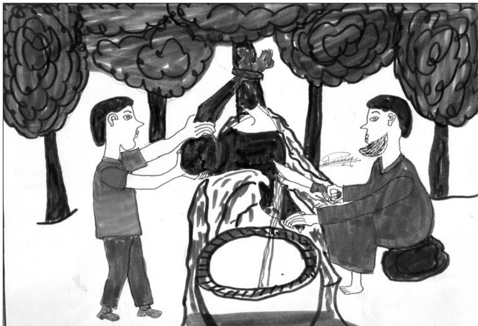
Dessin 12: le sacrifice d'un chien pour le travail de l'or

accroché ses pieds à l'arbre. Après ils vont manger. On te donne ta part. Ça ne se vend pas, un sacrifice on ne vend pas. On ne vend pas d'un animal sacrifié. Si tu fais un sacrifice et si tu ne veux pas donner, le fétiche te tue. C'est le sang et les plumes qu'on donne au huonthil plus quelques os. Le fétiche n'a pas de bouche, c'est nous qui mangeons.