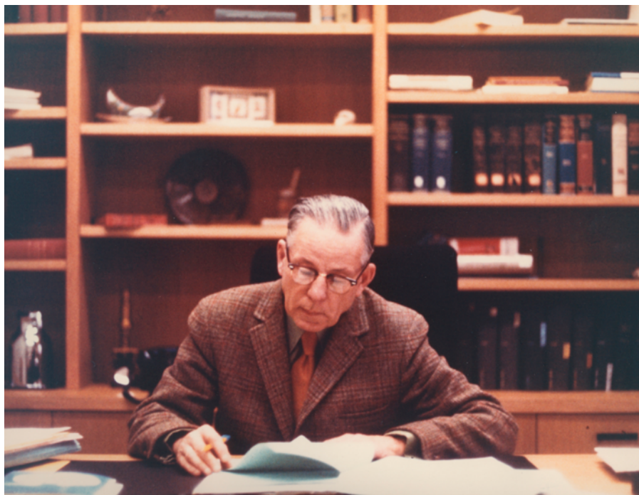
Figure 1 : Armand Frappier dans son bureau, dans les années 1970.

Un inventaire détaillé de ses archives est issu de ce projet et a contribué à donner un premier aperçu du contenu du fonds. Ces archives serviront entre autres à la production d'un documentaire biographique sur le D r Frappier réalisé en 1995 par Nicole Gravel 5 . Par contre, même avec un inventaire détaillé à la clé, le fonds demeure sous-exploité. Il faut noter que même si l'instrument de recherche était remarquablement détaillé, une absence d'indexation rendait son utilisation laborieuse. Sa publication survient aussi avant l'introduction des Règles pour la description des documents d'archives (RDDA) (en 1990), ce qui le rend non conforme au format de description encore en vigueur de nos jours. Toutefois, au-delà de l'importance de son créateur et de son accessibilité limitée, le nouveau traitement de ce fonds a été rendu nécessaire par la présence d'une vingtaine de boîtes de documents supplémentaires qui n'avaient jamais été intégrées au fonds. Il s'agissait de documents que le D r Frappier avait encore en sa possession lors de son décès et qui avaient tout bonnement été rangés sur des tablettes d'un de nos dépôts.