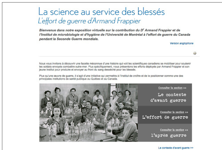
Figure 5: Sobre mais efficace: la page d'accueil de notre exposition virtuelle.

Fort heureusement, nous avons ce plan de rechange: notre propre site Web et mes très compétents collègues du Service des communications de l'INRS. Deux personnes de cette équipe étaient donc prêtes à faire une dernière relecture des textes et à mettre images et textes en ligne dans une interface sobre qui s'harmonisait bien avec le look du site Web de l'INRS.