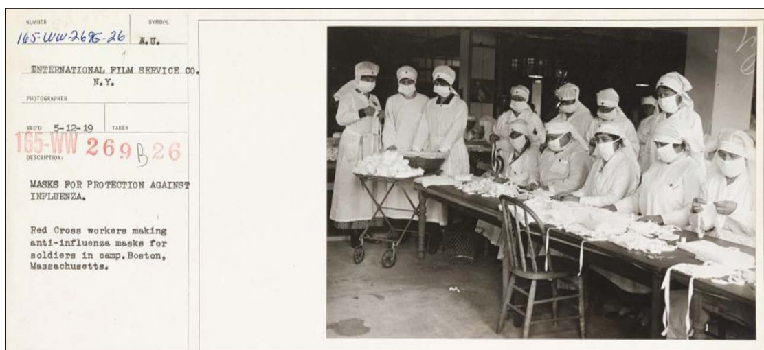
Figure 2: « Masques de protection contre l'influenza. Travailleuses de la Croix Rouge faisant des masques antigrippes pour des soldats des camps. Boston, Massachusetts ». National Archives of the United States, photographie N°45499341/165-WW-269B-26.

On conseille aussi de mettre un masque protecteur car il limite la diffusion des germes et si on ne dispose pas de masques, on peut aussi, écrit un médecin, dans Le Matin remplacer ce masque par « une simple compresse hydrophile trempée dans l'eau bouillie, posée sur le nez et la bouche et attachée par-dessus les oreilles avec un cordonnet ».