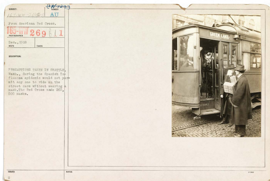
Figure 1: «Précautions prises à Seattle durant l'épidémie de grippe espagnole, ne permettant à personne de circuler dans la rue sans masque. La Croix Rouge fit 260 000 masques». Décembre 1918. National Archives of the United States, photographie N° 45499311/165-WW-269B-11.

l'imposition du masque sanitaire dans les lieux publics durant l'épisode de 1917-1918 aux États-Unis, ainsi que de la participation de la Croix Rouge à la production des masques. Ces photographies ont été largement exploitées depuis le début de la crise de la COVID-19. Deux documents de 1918 et 1919 sont pertinents, en raison de l'image, mais aussi et surtout des descriptifs qui les accompagnent : un premier cliché rapporte le cas de la ville de Seattle où le masque fut obligatoire dans les lieux publics et les transports, et pour laquelle la Croix Rouge fournit 260 000 masques (Figure 1) ; et un second, présente des membres de la Croix Rouge de Boston préparant des masques en tissu (Figure 2) 2 :