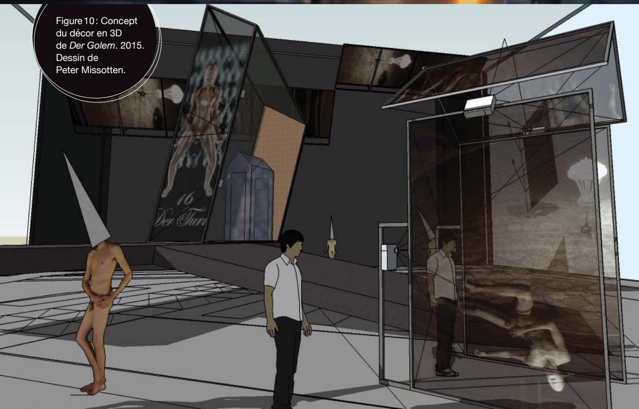
Figure 10 : Concept du décor en 3D de Der Golem . 2015. Dessin de Peter Missotten.