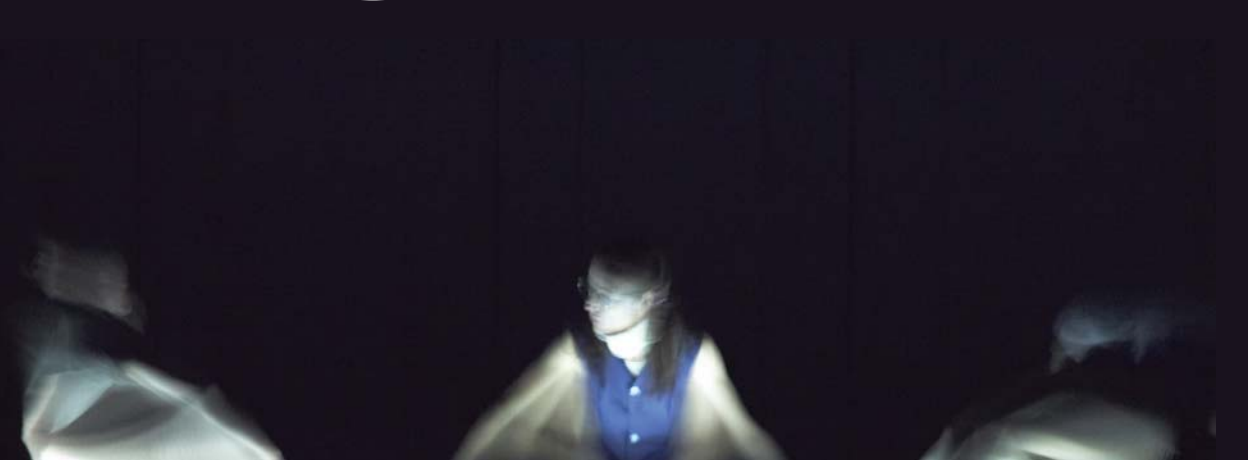
Figure 8 : Les marchands . Théâtre Charles Dullin, Chambéry (France), 2006.