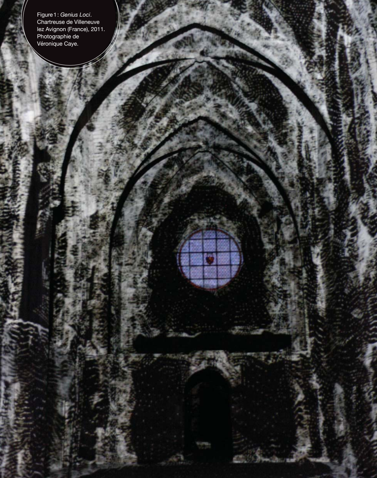
Figure 1 : Genius Loci . Chartreuse de Villeneuve lez Avignon (France), 2011.