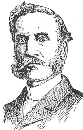
Sir Adolphe-Basile Routhier (1839-1920)