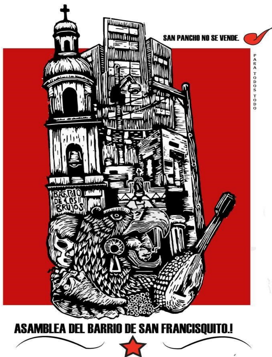
Imagen 1. Logo de la Asamblea del barrio de San Francisquito. Autor Miguel Palabras Hidalgo.

Estos grupos realizaron diversas acciones incluyendo campañas de firmas, eventos culturales e informativos y una serie de manifestaciones que se distinguieron por el uso de la danza ritual como una novedosa forma de protesta. En total fueron cinco movilizaciones con danza las convocadas por integrantes de las mesas concheras y de la Asamblea. Las múltiples acciones de lucha desplegadas lograron que después de siete meses desde su anuncio el titular del Instituto Queretano del Transporte anunciara la suspensión del proyecto.