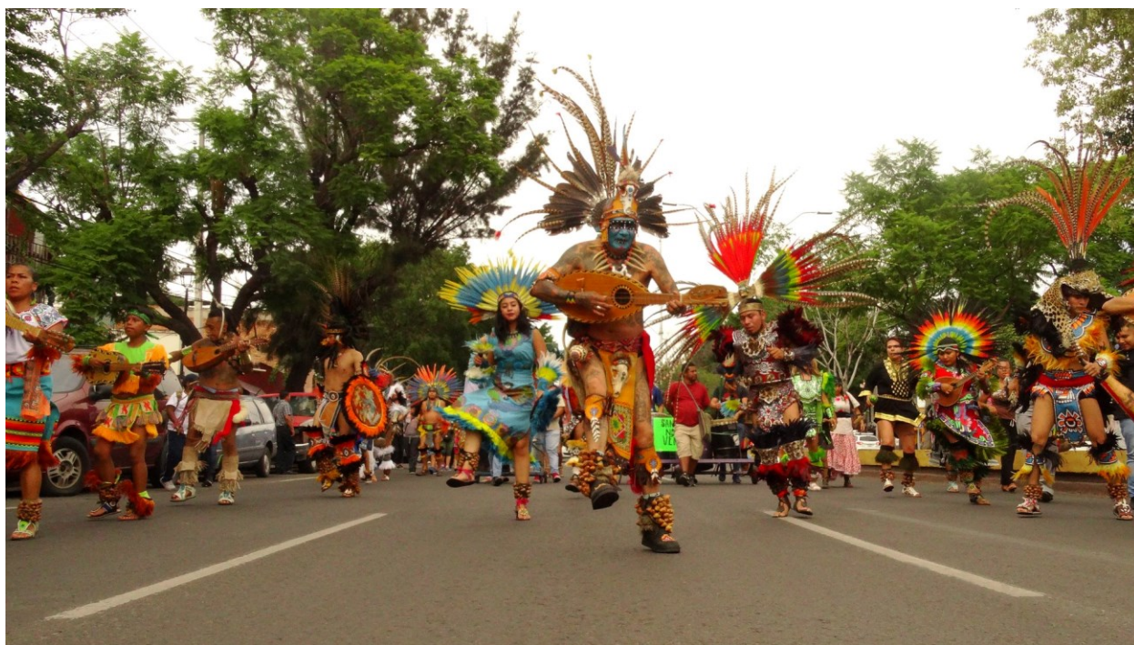
Imagen 2. Movilización en contra del eje vial Zaragoza, Agosto de 2019, Querétaro.

Durante la pandemia del COVID-19 las acciones desplegadas por la organización del barrio estuvieron centradas en fortalecer la reproducción material y simbólica de la vida social. Estas acciones incluyeron colectas solidarias de despensa, la apertura temporal de un comedor comunitario y la construcción de un huerto comunitario. Asimismo, en el año 2021 se creó un tianguis comunitario, no solo como respuesta a las afectaciones económicas de la pandemia, sino también como un espacio de organización que tiene su propia asamblea y como una forma de ocupar el espacio público. Sumado a esto, en agosto de ese mismo año se abrió el salón comunitario “Ngü Därimui, Casa del Gran Corazón”, que funciona como un espacio para el intercambio de saberes entre los habitantes mediante la impartición de talleres y para la realización de reuniones y eventos comunitarios.