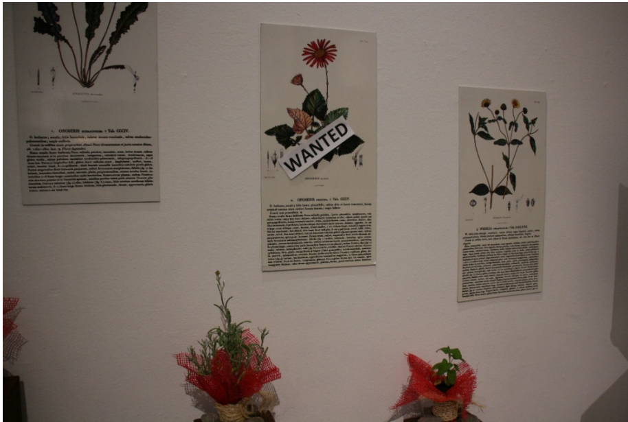
Figura 4. Stand del GAD de Alausí.

En el caso de la revista Ñan , presentaban en la exposición su número 34, un especial sobre Humboldt financiado por la Embajada de la República Federal de Alemania en Quito. La parte más llamativa de su stand, desde nuestro punto de vista, fue el panel donde estaban todos los hombres que lo reconocían. Pese a que la revista es quiteña, los hombres – únicamente hombres – presentes eran todos ellos blancos, a excepción de Simón Bolívar, del que se destacó la frase de que reconocía a Humboldt como el “verdadero descubridor de América”.