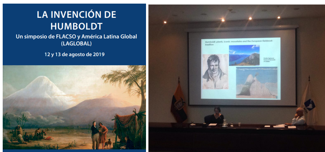
Figura 10. Afiche y fotografía del evento.

En esta ocasión, el blanqueamiento del espacio se produce por omisión. La ausencia de una perspectiva indígena en el Simposio hizo que la crítica a la celebración de Humboldt quedase confinada a una disputa sur-norte entre hombres blancos o blanco-mestizos, con fuertes privilegios en ambas sociedades, que tienen un reconocimiento diferencial entre el Sur y el Norte globalizado. Sin restar importancia a esta cuestión, de nuevo el centro se encuentra en el lugar de enunciación privilegiado, y reproduce el colonialismo epistémico respecto a los pueblos y nacionalidades indígenas. Por ello, el blanqueamiento espacial en la academia se ve reforzado, reproduciendo los límites que supone generar una crítica descolonizadora profunda a la forma en la que se produce el conocimiento, mientras se mantienen incólumes los diálogos interculturales y se siguen reproduciendo prácticas de extractivismo epistémico con las comunidades y pueblos con los que trabaja la academia ecuatoriana.