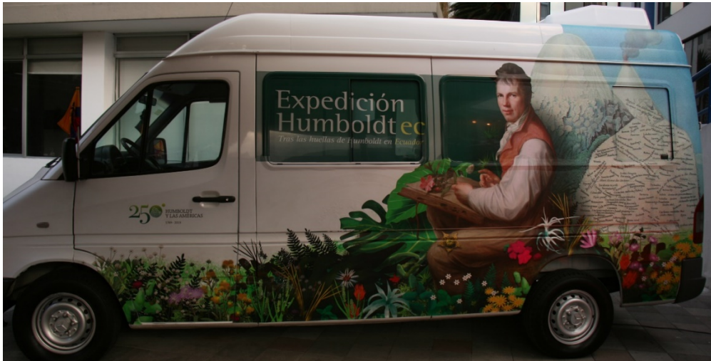
Figura 8. Humboldt-Móvil en la PUCE.