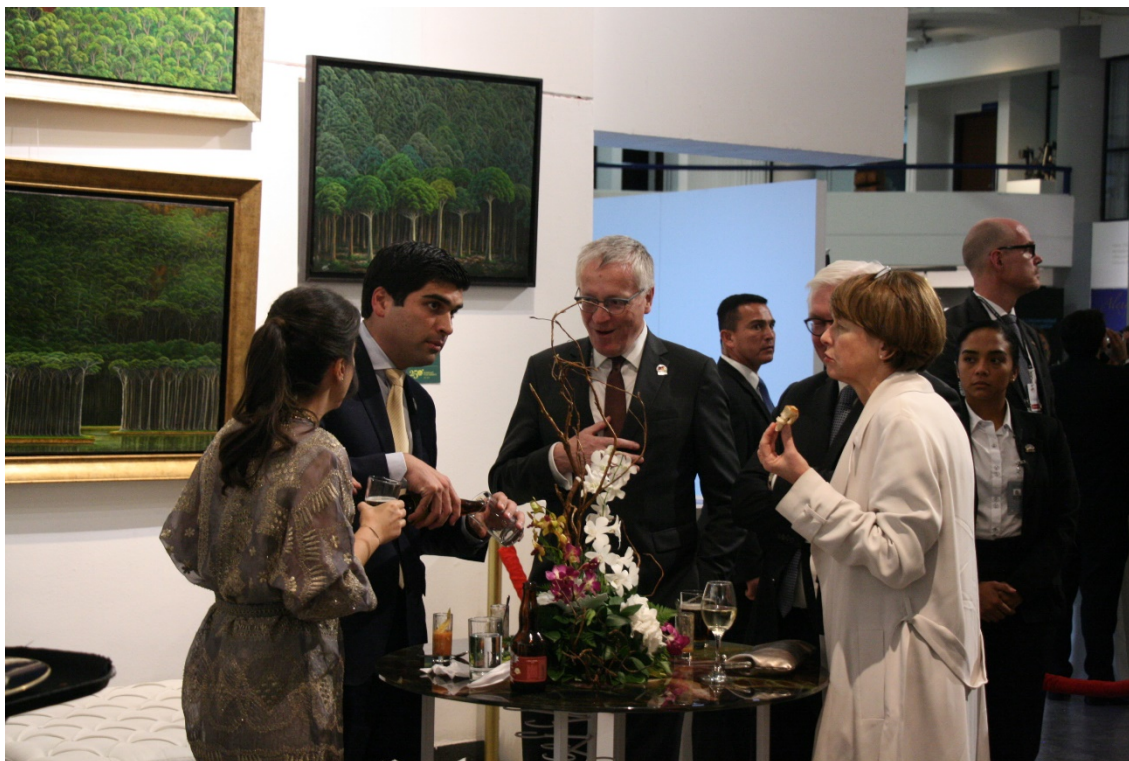
Figura 3. Autoridades en un resguardado Rincón Humboldt, rodeados de selvas sin personas.

Entre el resto de los invitados, había representantes de Gobiernos Autónomos Descentralizados (GAD), universidades, revistas científicas o de divulgación, así como otras instituciones de la sociedad ecuatoriana. Pudimos realizar algunas entrevistas a los presentes. Por ejemplo, el GAD de Alausí (provincia de Chimborazo) traía una exposición de plantas que tenían nombres relacionados con Humboldt como eje para la atracción del turismo. Habían creado senderos y exposiciones con la cuestión. En el caso de la exposición del GAD es especialmente llamativo, porque obviaba las formas en las que se daban los usos ancestrales o las formas no científicas de denominar a las plantas. Sus representantes destacaron en nuestra entrevista que “la población mestiza e indígena en todo el país piensa que las plantas nativas es mala yerba, y lo que hacían era arrancar para poder sembrar, nosotros tenemos una siembra colectiva con la población indígena”, refiriéndose, por supuesto, a las plantas descubiertas por Humboldt. Después de 200 años de la pasada de Humboldt, los gobiernos locales siguen pensando que el hombre blanco debe ilustrar a la población local en el manejo del territorio, en una ocultación de los saberes indígenas que ubica el cuidado de los espacios comunes como un conocimiento y una práctica blanca, en total oposición a lo que ocurre en la realidad de los territorios andinos (De la Cruz et al. 2009; Cuzco & Senaida 2016).