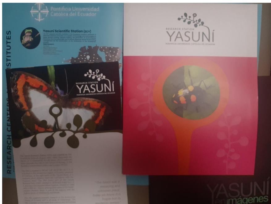
Figura 7. Folletos sobre de la PUCE sobre el Yasuní.

La naturaleza en la celebración de Humboldt, es una exterioridad a ser aprehendida y protegida sin los pueblos que la han habitado, y hasta sembrado. En el caso del Yasuní, algunos de los pueblos indígenas que lo habitan se encuentran en Aislamiento Voluntario, y gozan de una protección y reconocimiento adicionales, y tampoco se encuentran en el stand, folletos o discurso de la universidad. La explotación petrolera del Yasuní, uno de los hechos más conocidos en la escala global sobre este espacio, no está presente en la celebración, pese a que se está llevando un genocidio contemporáneo en esa región. Esto muestra cómo en esta celebración colonial, quienes se arrojan seguir los pasos de Humboldt ocultan a las poblaciones que defienden con su existencia ese espacio ya que las mismas se encuentran bajo el acoso del capitalismo extractivo (Bayón y Arrazola 2019; Castro Salvador 2017). También estaba el Ministro de Educación, que preguntado sobre la lectura de Humboldt en el Ecuador de hoy, destacó su sed de conocimiento, en un tono más sosegado que el de la propia celebración, incentivando a "los chicos a la investigación científica". Destacó también a Humboldt como un personaje clave en la historia de la humanidad.