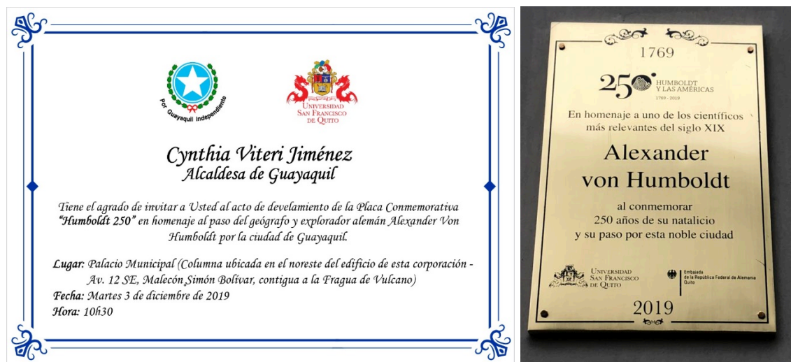
Figura 9. Invitación al evento en Guayaquil.

Uno de los eventos que prometía mayor crítica y rigurosidad analítica sobre Humboldt fue aquel celebrado en FLACSO-Ecuador (Facultad Latinoamericana de Ciencias Sociales) con un gran evento de reflexión sobre el pensamiento de Humboldt desde una perspectiva latinoamericanista. El evento se llamó “La Invención de Humboldt” y contenía en su programa un fuerte cuestionamiento, al fin, a la lectura colonial actual de su figura y su representación en América Latina. 4 La primera conferencia magistral de Jorge Cañizares-Esguerra, de la Universidad de Austin en Texas, fue una demoledora crítica a Andrea Wulf y su best-seller “La Invención de la Naturaleza”. Esta crítica se basó en el paralelismo entre el extractivismo epistémico no reconocido que realizó Humboldt con los intelectuales de su época, y el que, según él, ha cometido Wulf en la actualidad con intelectuales contemporáneos (de forma implícita se refería a estudiosos como él).