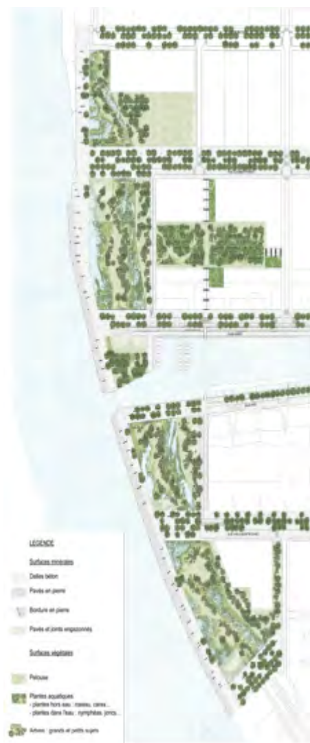
Figure 3. Plan masse du Projet des jardins aquatiques / Master plan of the Project of the aquatic gardens

Concepteurs : Michel Desvigne et François Grether