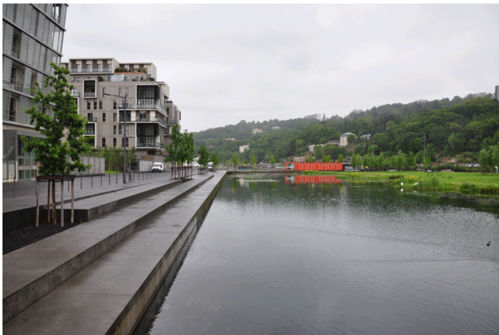
Figure 4. Vue- Les jardins aquatiques / View — The aquatic gardens