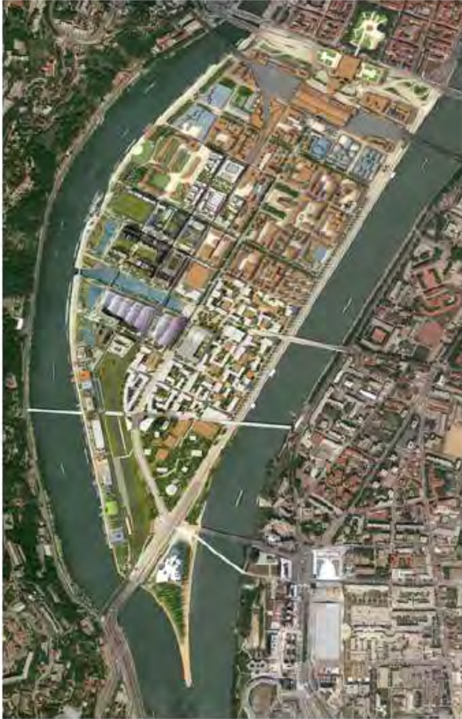
Figure 2. Plan masse du Projet de la Confluence / Master plan of the Project of the Confluence