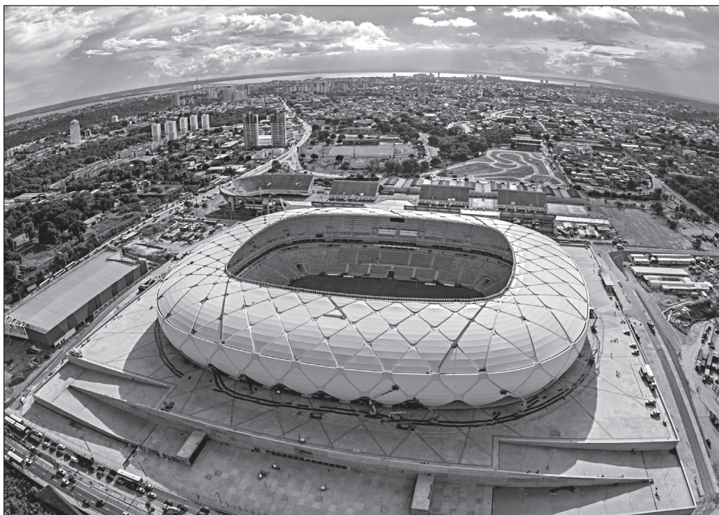
ILLUSTRATION 7 : Arena Amazonia, Manaus (Brésil)