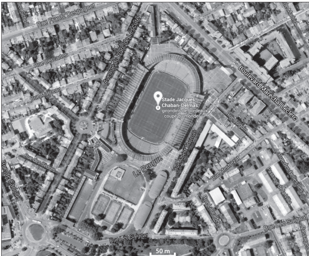
ILLUSTRATION 5 : Stade Chaban-Delmas, Bordeaux (France).