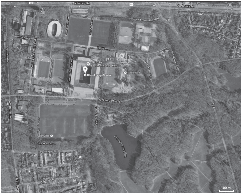
ILLUSTRATION 4 : Rheinenergie Stadion, Cologne (Allemagne).