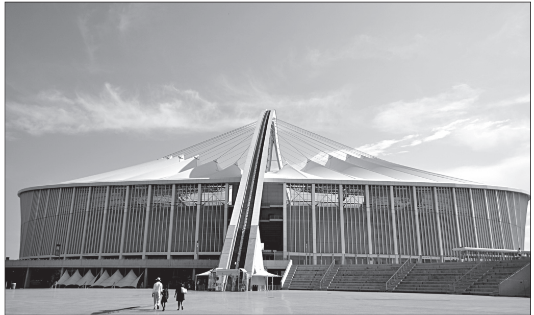
ILLUSTRATION 8 : Moses Mabhida Stadium, Durban (Afrique du Sud) (photo : Darren Glanville/Wikimedia Commons).

un club porteur. L'architecture et l'insertion urbaine soignées des stades, notamment démontrées par les images satellites, célèbrent la qualité de vie métropolitaine. Toutefois, seule Daegu, engagée comme six autres villes-hôtes du Mondial dans l'actuel programme gouvernemental « Be inspired, visit Korea », a inscrit son stade dans l'un de ses circuits touristiques en autobus. Ces modèles se différencient surtout au plan managérial, public en Corée et largement privatisé au Japon où la promotion touristique des enceintes est plus offensive (visites guidées, utilisation des outils numériques, etc.).