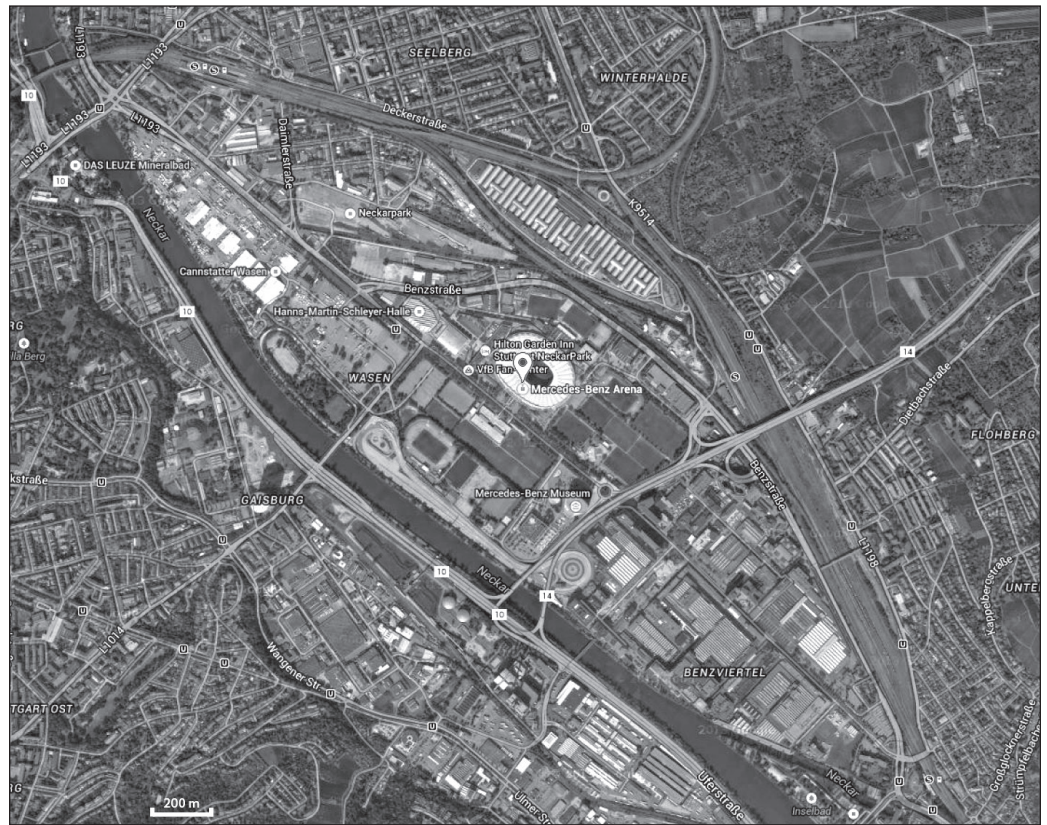
ILLUSTRATION 3 : Mercedes-Benz Arena, Stuttgart (Allemagne).

représenterait « La Mecque du consumérisme pour supporter, où le public vient 3 heures avant le match, dépense 8 euros dans les buvettes (contre un euro en moyenne en France) et peut placer ses bambins dans des garderies » (Mathiot, 2007). Elle polarise un quartier dont l'équipement – multiplex cinématographique, centre ludo-sportif, hôtel haut de gamme auxquels, ailleurs, pourraient s'ajouter musée, commerces ou aréna couverte – figure une énième occurrence de la ville-marketing ( Urbanisme , 2004). Ce modèle urbanistique mercantile promeut la multiplication de zones récréotouristiques standardisées et la privatisation de l'espace public au profit de stratégies industrielles, comme à Stuttgart avec Mercedes-Benz (illustration 3). Les images satellites révèlent un autre modèle d'aménagement récréatif et touristique, plus général. Il s'organise en stades ultramodernes, hérités du Mondial, qui sont pourvus d'équipements ludiques et sportifs adjacents répondant aux besoins socio-éducatifs quotidiens, très bien reliés au centre-ville et connectés à de vastes espaces verts ou boisés, souvent agrémentés d'un plan d'eau et favorisant les circulations douces (illustration 4). Seules la Mercedes-Benz Arena et l'Allianz Arena de Munich, stade privé enserré par des voies rapides et doté du plus vaste stationnement d'Europe, dérogent à ce lien Ville-Nature planifié par les pouvoirs locaux et exaltant l'image d'une qualité de vie métropolitaine.