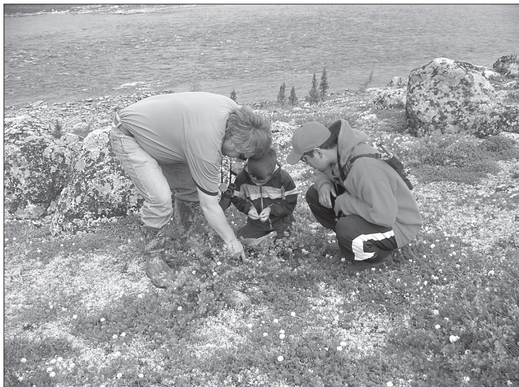
ILLUSTRATION 2 : L'abondance et la distribution des espèces végétales dans le Grand Nord sont directement touchées par les changements climatiques (photo : Mélanie Chabot, gracieuseté de l'Administration régionale Kativik (ARK)).

Puisque les processus phénologiques des espèces végétales sont essentiellement génétiques, plusieurs sont incapables d'ajuster leur temps de développement suite à des changements environnementaux rapides (Borner et al. , 2008). Par contre, un avantage pour plusieurs espèces végétales nordiques est que la saison de croissance est courte. Elles ont adopté un patron de floraison rapide pour maximiser le temps restreint pour la photosynthèse et un développement des fruits plus long pour attendre un sol découvert de neige pour la dispersion des graines (Cebrian et al. , 2008).