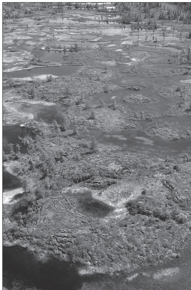
ILLUSTRATION 1 : Vue aérienne de la végétation du parc national Kuururjuaq (photo : Robert Fréchette, gracieuseté de l'Administration régionale Kativik (ARK)).

La prolifération de l'épinette noire ( Picea mariana ) est aussi à suivre, car les conditions physiologiques propres à cette espèce lui permettent déjà de pousser au-delà de son aire de répartition qui est déterminée par la température (Bonan et Sirois, 1992). Dans la forêt subarctique du Québec, le couvert forestier dans la toundra est restreint par la faible capacité de reproduction des épinettes noires de forme arbustive et du développement de tiges dressées au nord de sa distribution (Gamache et Payette, 2005). Par contre, une plus grande chaleur accumulée amène le développement des épinettes de forme krummholz vers une forme de croissance érigée, avec une tendance positive de l'élongation des pousses dominantes (Gamache et Payette, 2004). Les températures estivales sont importantes pour la croissance des anneaux des arbres, mais aussi pour la migration des arbustes vers le nord (Knorre et al. , 2006). L'étendue de l'écotone entre la forêt boréale et la toundra semble aussi être liée aux précipitations hivernales (Gamache et Payette, 2004). Le récent réchauffement climatique entraîne une augmentation du couvert de neige et affecte le patron de recrutement des épinettes. L'accumulation de neige en bordure des forêts, là où les pousses d'épinettes tendent à s'installer, diminue les chances d'établissement, surtout au bas des pentes raides en marge des forêts où la neige glisse facilement du sommet des montagnes (Gamache et Payette, 2004 et