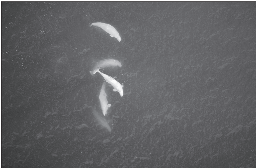
ILLUSTRATION 4 : Bélugas dans les eaux du Nunavik (photo : Robert Fréchette, gracieuseté de l'Administration régionale Kativik (ARK)).

Voilà pourquoi nous traitons les Inuits comme nos frères, parce qu'eux nous donnaient ce qu'ils avaient tué, si nous[,] on n'avait pas été assez fortunés ou assez chanceux de tuer des bêtes pour nous-mêmes (Québec, 2008d).