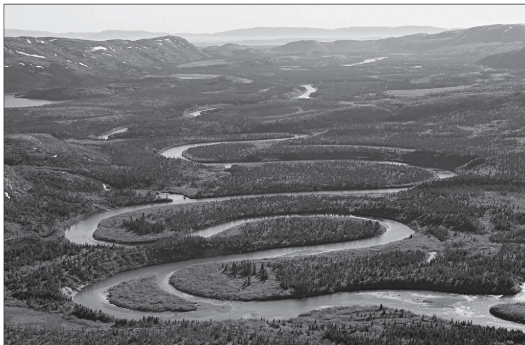
ILLUSTRATION 1 : Vue sur le Parc national Tursujuq.

patrimonialisation et son milieu, plusieurs recherches mettent en lumière les manières par lesquelles les acteurs coconstruisent leurs représentations, les adaptent ou les remettent en question pour en créer de nouvelles (Berkes, 2004; Leroux et al. , 2007; Prangnell et al. , 2010; Ramousse et Salin, 2007).