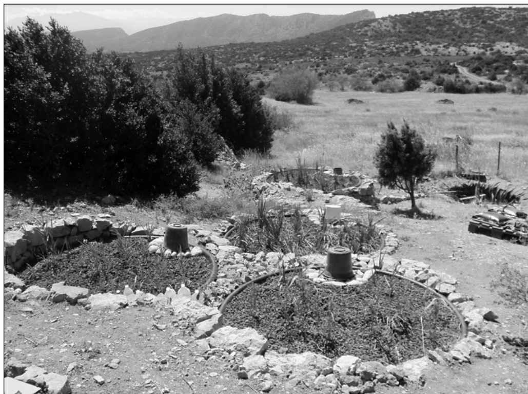
ILLUSTRATION 3 : Bassins de phytoépuration, 2010.

intégrité historique a été préservée. Pour une association de restauration du patrimoine, un endroit aussi intact représente un véritable trésor, c'est pourquoi Terre de pierres a décidé de renoncer à un certain confort afin de préserver ce qu'on pourrait appeler « l'esprit du lieu ». En 2006, par exemple, alors que l'association débutait ses travaux sur le site de Périllos, l'électricité a été installée au village. Afin d'obtenir la mention de « terrain constructible » par le plan d'urbanisme de sa municipalité, un terrain doit être raccordé aux réseaux électrique, d'eau potable et d'assainissement. Toutefois, les membres de l'association ont refusé le raccordement au réseau d'eau potable qui leur était proposé par la mairie. Pourquoi cela ? À Périllos, grâce à une autorisation du conseil municipal, les lots ont été juridiquement attribués du statut de constructibilité limité qui permet de restaurer les bâtiments existants selon des exigences précises, mais ne permet pas d'obtenir le statut de terrain constructible ni d'y résider. De cette manière, les membres de l'association évitent que leurs restaurations amenant une reprise de valeur inévitable des terrains n'incitent des commerçants et des promoteurs à y développer leurs projets, ce qui viendrait anéantir tous leurs efforts de préservation.