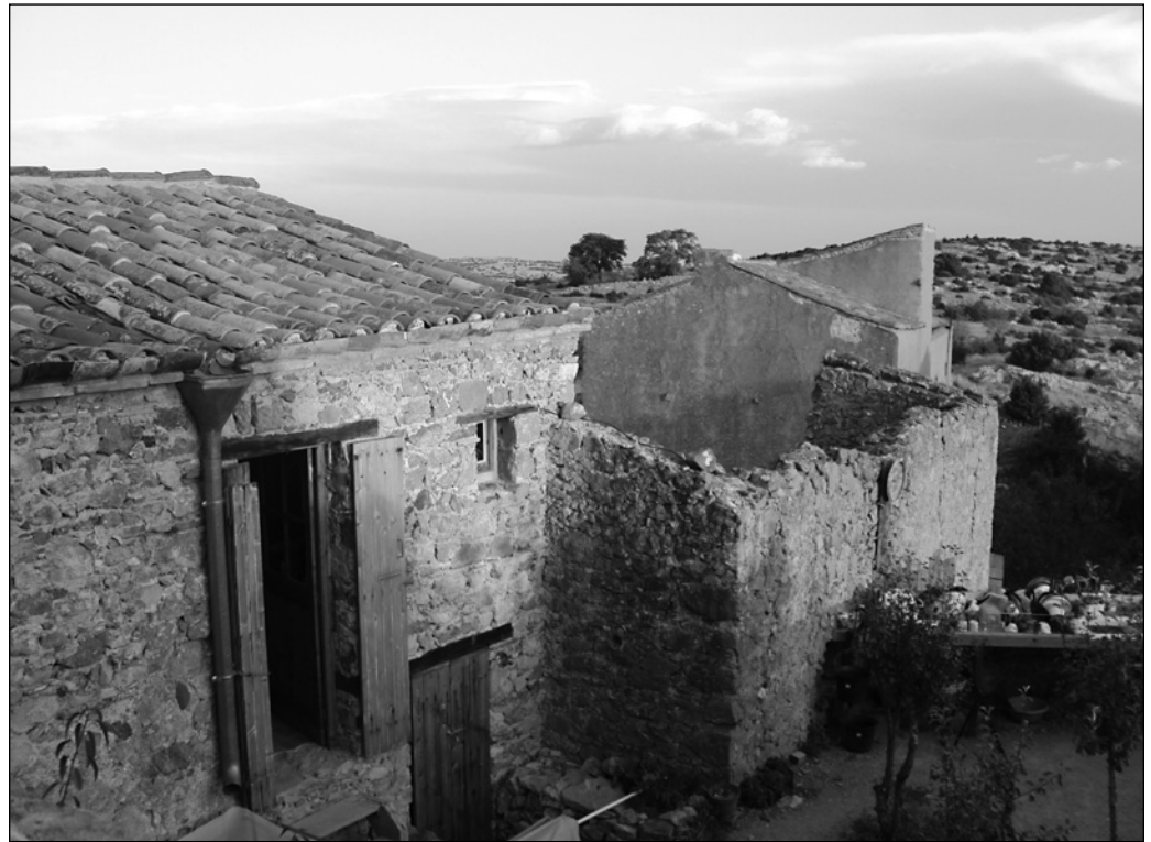
ILLUSTRATION 4 : Ancienne école du village de Périllos restaurée et transformée en cuisine et réfectoire, 2010.

À son arrivée sur le site, l'association a bénéficié de l'accès au réseau électrique qui était déjà en place grâce à l'installation d'un radar de Météo France sur le Montoullié à proximité. Comme on le sait, elle a cependant renoncé à faire venir l'eau, un choix difficile dans une région où il pleut aussi rarement (moins de 60 jours par an). L'eau y constitue véritablement une denrée rare. On entretient donc là-bas un rapport très particulier avec cette ressource essentielle, tel qu'on ne le conçoit pas encore en Amérique du Nord. Dans un pays où il existe des crédits d'impôt pour la récupération d'eau de pluie depuis 2006, chaque litre d'eau à Périllos est parcimonieusement utilisé.