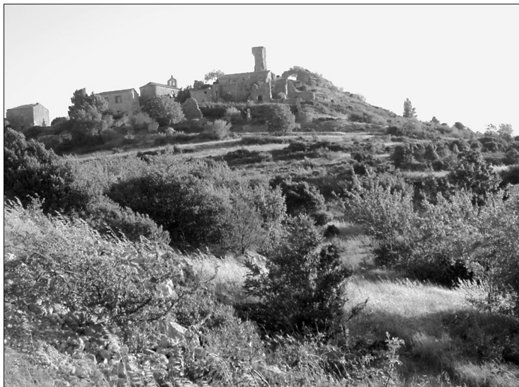
ILLUSTRATION 1 : Village de Périllos, 2010.

réparties entre septembre 2009 et août 2011. La documentation accumulée comprend les rapports d'activité de l'association, des entrevues orales et télévisuelles avec les membres-fondateurs de Terre de pierres, ainsi que de la documentation iconographique sur l'avancement des travaux. Cependant, avant de passer à la démonstration, commençons d'abord par présenter brièvement l'histoire du hameau de Périllos et de l'association qui le protège depuis cinq ans.