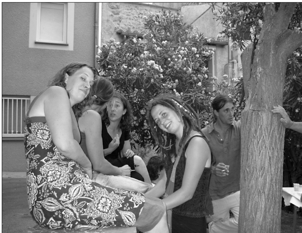
ILLUSTRATION 9 : Bénévoles de REMPART à la fête du 14 juillet 2010 à Opoul, 2010 (photo : Amélie Masson-Labonté).

architecture ou en histoire de l'art, mais aussi des retraités, et des travailleurs de tout horizon. Certains sont là pour réaliser un stage relié à leurs études, les autres pour découvrir le pays d'une façon différente. L'objectif, explique en entrevue Estelle Dedeband, présidente de Terre de pierres, est d'accueillir les bénévoles qui viennent donner de leur temps, et en échange on leur offre une initiation aux gestes ancestraux de la construction rurale (Choron, Lllamarich et Mathou, 2010). Tous participent donc aux restaurations en apprenant les bases du métier de maçon (voir illustration 8).