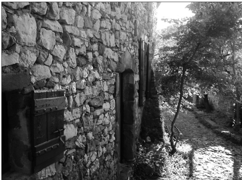
ILLUSTRATION 2 : Vieux village de Saint-Victor-la-Coste, 2011 (photo : Amélie Masson-Labonté).

de cuisson donne une couleur noire à la céramique à cause de l'absence d'oxygène dans le four. Ce mode de cuisson est souvent utilisé par souci d'économie de bois. Cet élément pourrait donc faire remonter l'occupation du site au XI e siècle.