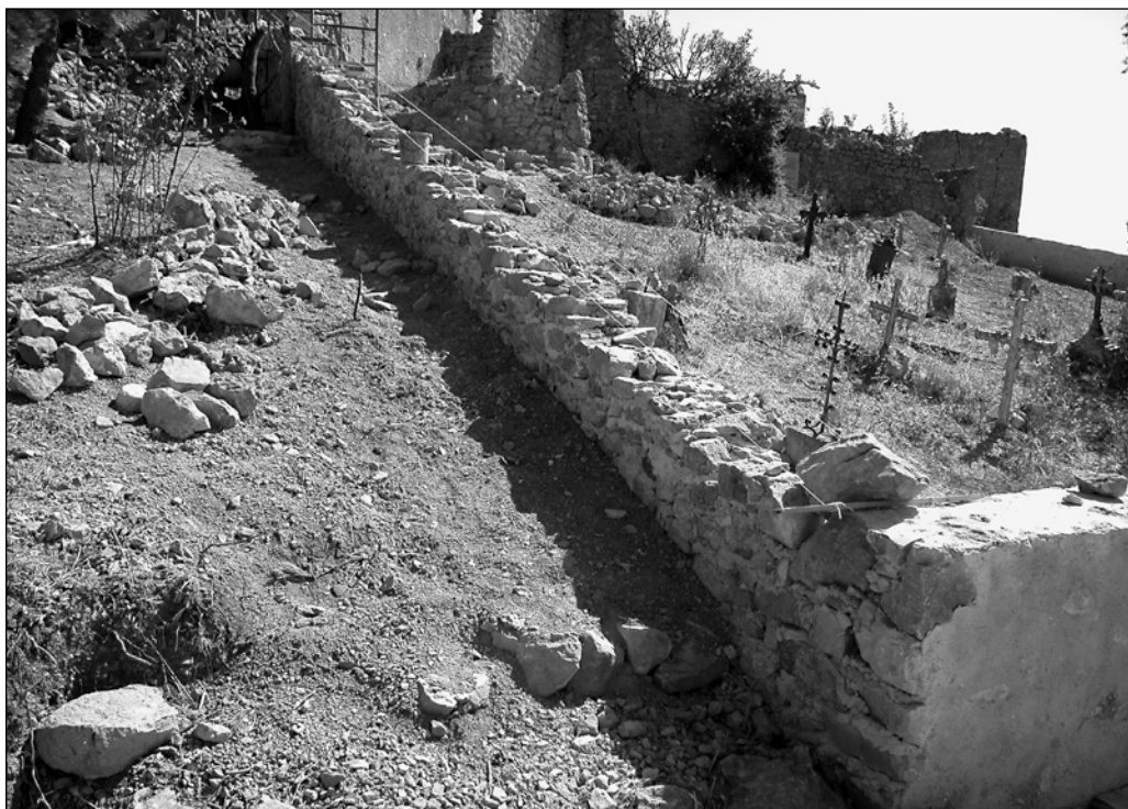
ILLUSTRATION 5 : Construction du mur du cimetière, 2009.

au projet. Ils souhaitent atteindre ce qu'Alan Clarke qualifie de « mutual beneficial activity » (2009 : 159).