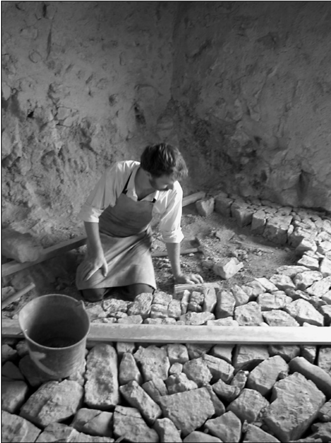
ILLUSTRATION 6 : Réalisation d'un empierrement pour paver le sol de la remise, 2009.