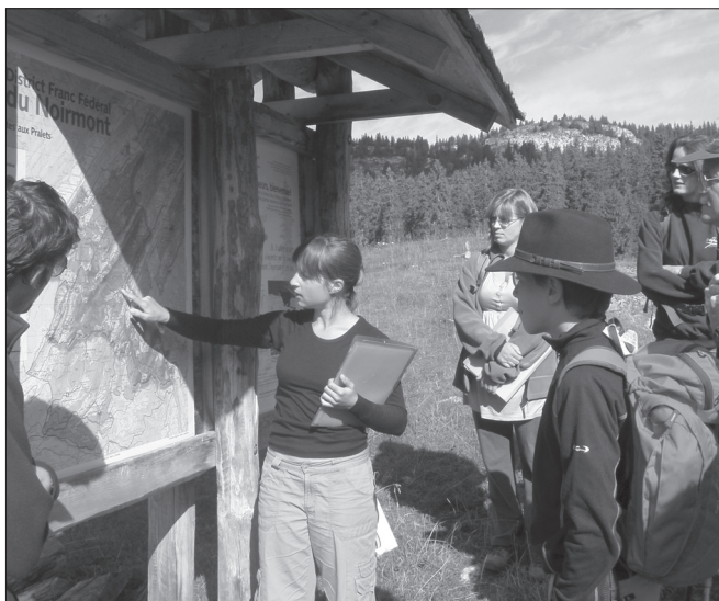
ILLUSTRATION 3 : Excursion guidée sur les géomorphosites du Parc Jurassien Vaudois, avec un public hétérogène (Les Pralets, Jura vaudois).