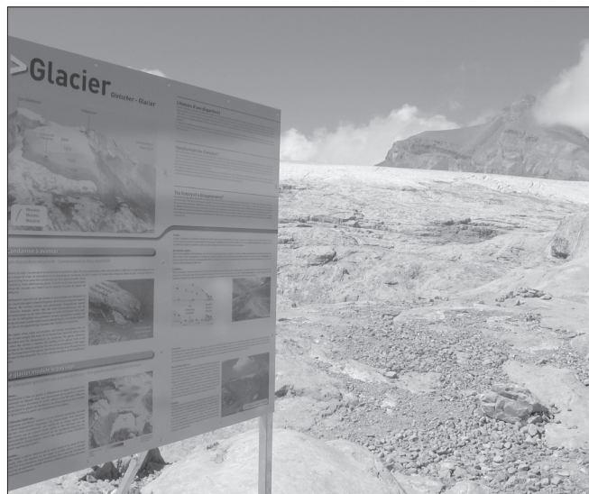
ILLUSTRATION 4 : Panneau thématique sur la géomorphologie et la dynamique glaciaire, en lien direct avec le site (Tsanfleuron, Alpes valaisannes).

extraordinaire. Pour mettre en lumière les qualités géoscientifiques d'un lieu, souvent méconnues du public, un projet géotouristique devrait s'appuyer sur des géosites, c'est-à-dire des sites aux qualités (ou valeurs) reconnues : scientifiques (Grandgirard, 1999), esthétiques, culturelles, économiques ou écologiques (Panizza et Piacente, 1993; Reynard, 2005). Lorsqu'on s'intéresse plus particulièrement à l'usage touristique des sites, d'autres critères entrent en jeu comme l'accessibilité ou la valeur scénique (Pralong, 2005). La « facilité de lecture » d'un site, son potentiel didactique joue aussi un rôle (Kozlik, en cours). Par conséquent, tout géosite n'est a priori pas propice au géotourisme, et ce, d'autant moins si l'on s'adresse à un public de non-spécialistes.