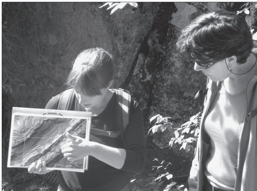
ILLUSTRATION 5 : Usage de supports visuels (modèle numérique de terrain) lors d'une excursion guidée sur les géomorphosites du Parc Jurassien Vaudois (Mont Sâla, Jura vaudois).

(brochure, carte, panneau), il sera très difficile de séparer clairement les différents discours sans augmenter la taille de l'objet, au risque de rebuter le lecteur dès l'abord. Enfin, tout site possède une ou plusieurs caractéristiques singulières qui « méritent la visite ». C'est sur celles-ci que l'accent doit être mis dans un processus de valorisation (Regolini-Bissig, 2010). Multiplier les thèmes abordés a surtout pour effet de noyer l'extraordinaire dans le banal et d'uniformiser le contenu des projets d'une même région, à l'instar des sentiers des Alpes de Suisse occidentale où l'on retrouve presque inévitablement un panneau sur la faune alpine ou la géologie régionale.