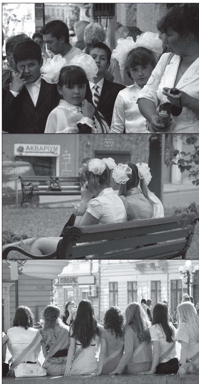
ILLUSTRATION 10 : La Chernivtsi d'Élinadav, 2007.

La deuxième génération constitue ce que Hirsch et Spitzer appellent « la génération de la post-mémoire » (2010 : 269).