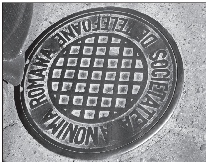
ILLUSTRATION 3 : Signes de la ville palimpseste. Période roumaine.