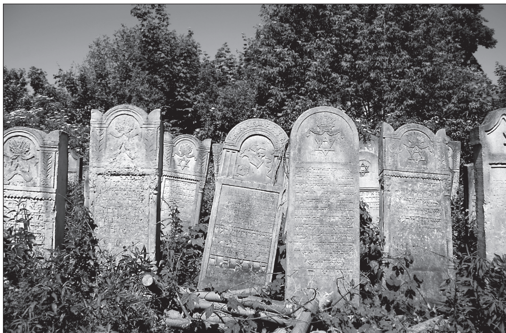
ILLUSTRATION 8 : Le cimetière juif.

ailleurs cette vision si poignante que l'on retrouve dans bien d'autres cimetières juifs de l'Europe centrale et orientale (voir illustration 8). Lors de mes différents séjours, des sépultures avaient été la proie des vandales : tombes profanées, croix gammées sur le beit hahepedim [bâtiment cultuel, à l'entrée du cimetière, où le corps du défunt est exposé avant l'inhumation et où sont prononcées les oraisons funèbres]. Et la nature luxuriante faisait le reste.