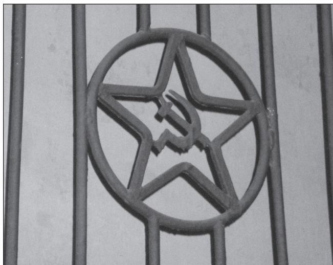
ILLUSTRATION 4 : Signes de la ville palimpseste. Période soviétique.

mémorielles et aux dilemmes émotionnels. On n'échappe qu'à grand peine à une méfiance, souvent réciproque, entre ceux qui reviennent et ceux qui occupent aujourd'hui les lieux que les premiers considèrent comme avoir été les leurs ou bien ceux de leur famille. Ces soupçons s'accompagnent, assez régulièrement, d'un complexe de supériorité, qui rejoint certaines expériences de la mentalité coloniale. Cette méfiance et ce complexe de supériorité expliquent sans doute les quelques dissensions qui se sont faites jour dans le groupe et notamment la relation avec les habitants actuels, qu'ils soient Juifs ou non-Juifs. La plupart des participants n'ont montré qu'un intérêt limité pour les Juifs actuels de la ville, la plupart n'ayant pas de lien avec ceux qu'ils considéraient comme les véritables Czernowitziens, les « authentiques », à savoir ceux de l'entre-deux-guerres.