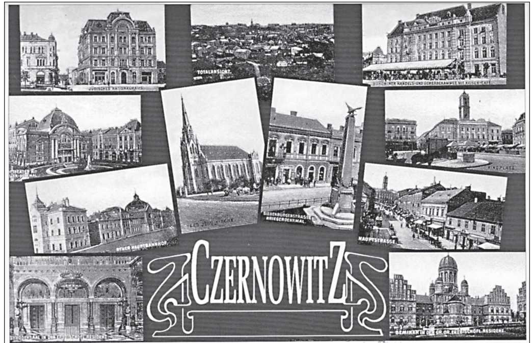
ILLUSTRATION 1 : Couverture d'une collection de cartes postales de Czernowitz (source : collections de Gennadig Jankowskij et Ivan Snihur, sur une idée de Sergij Osatschuk, Chernivtsi, 2003).

and tactile physicality of the “actual,” certainly, but also of the analog “originals” from which they were generated 2 . » (Hirsch et Spitzer, 2010 : 264) Pour citer Boym, dans The Future of Nostalgia : « Computer Memory is independent of affect and the vicissitudes of time, politics and history; it had no patina of history, and everything has the same digital texture 3 . » (2001 : 347, cité dans Hirsch et Spitzer, 2010 : 264)