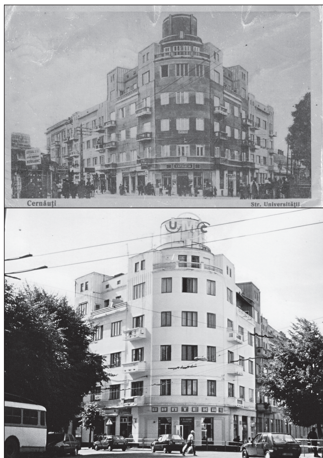
ILLUSTRATION 9 : La Czernowitz d'une deuxième génération : 1938 (a) ; 2000 (b).

que c'était le moment ou jamais — demain il serait peut-être trop tard — de passer le relais, de transmettre à leurs descendants des expériences jusque-là refoulées ou tues. L'idée d'un circuit organisé avait probablement rassuré certains encore craintifs des « fantômes » qu'ils risquaient de rencontrer. Lors du voyage de 2006, une dizaine de participants étaient effectivement nés dans la Cernăuţi des années 1920 et du début des années 1930.