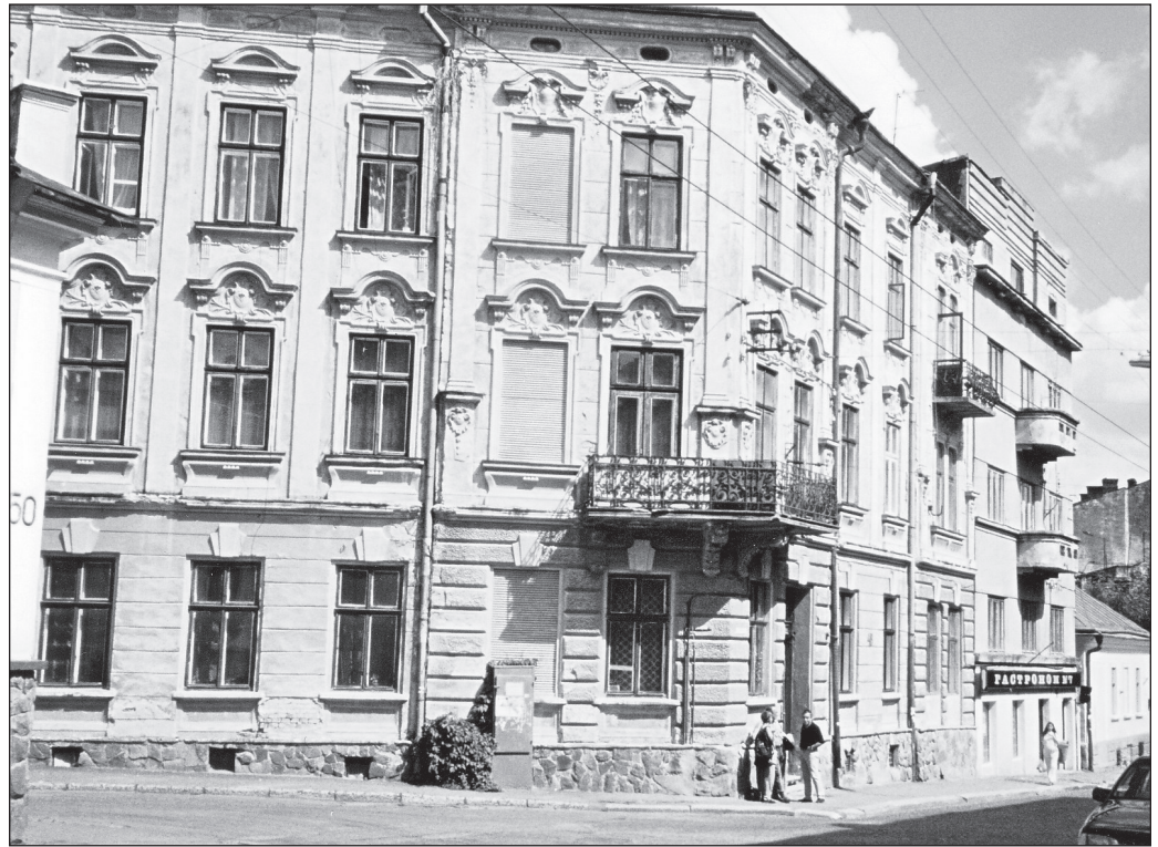
ILLUSTRATION 5 : À Czernowitz, maison familiale.

XIX e century, arts and sciences flourished due, naturally, to the Romanians. No mention of any Austrian, nor Jewish contributions, to the city's architecture, economy, culture, and civilization process. An incredible nationalism, seemingly worse than the Ukrainian one. [...] The final sentence – "even if today Czernowitz is Ukrainian, its heart beats for Romania!!!" The exclamation marks are mine 22 .