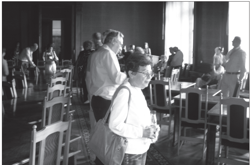
ILLUSTRATION 2 :

Toutes les expériences de tourisme des racines, qu'elles concernent les premières, deuxièmes ou troisièmes générations, mettent en jeu un certain nombre d'affects, liés aux attentes