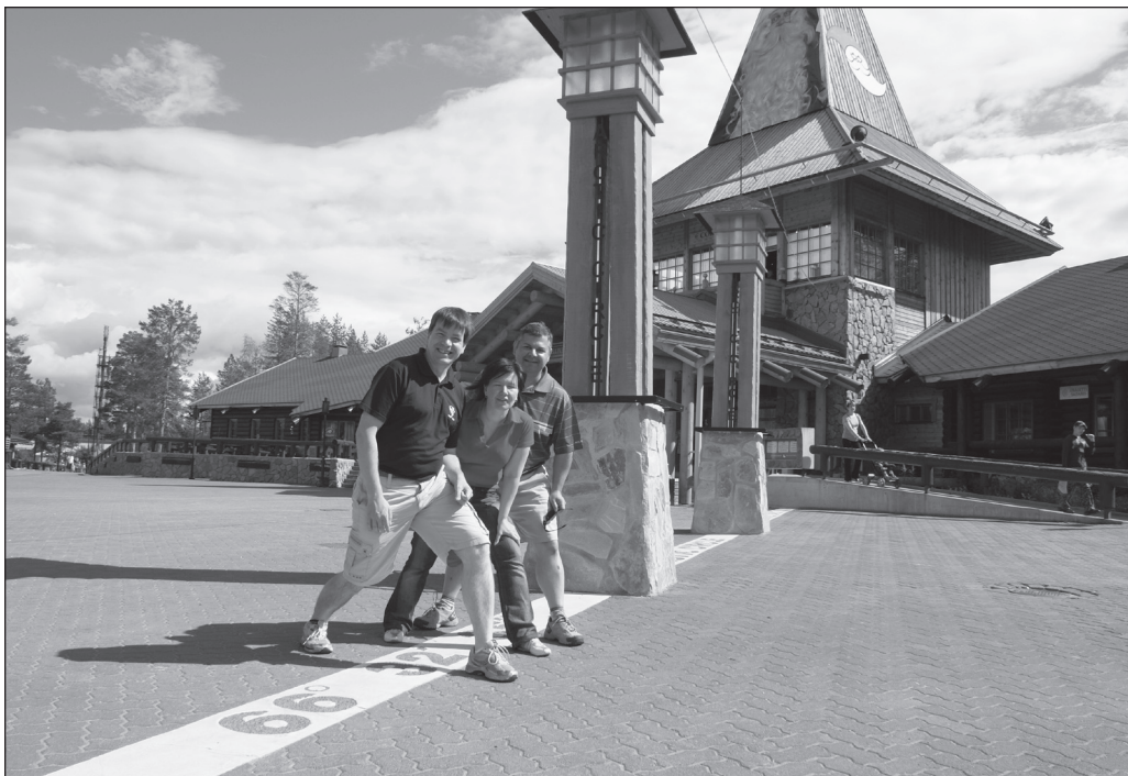
ILLUSTRATION 5 :

L'expérience du tourisme polaire peut aussi être motivée par des besoins identitaires. «J'ai appris que je peux faire des choses excitantes, vivre des aventures», confiait un croisiériste interrogé dans l'Arctique canadien. L'employé de bureau, âgé d'une vingtaine d'années, avait précisément choisi ce type de voyage pour «travailler» son identité et projeter, dans son environnement, l'image d'un homme moins urbain. Les outils socioculturels nécessaires à la construction de l'identité du touriste polaire proviennent des représentations des régions polaires décrites à la fois comme esthétiquement belles et horribles, marquées par l'isolement, les températures extrêmes et la menace sous-entendue de mort (Antomarchi, 2005 : 46), celle qui a marqué tant de récits d'explorateurs et de conquérants. Le tourisme polaire emprunte ici au tourisme d'aventure en proposant à ses adeptes des activités alliant un certain degré de peur et de risque (quoique très calculé) dans un environnement