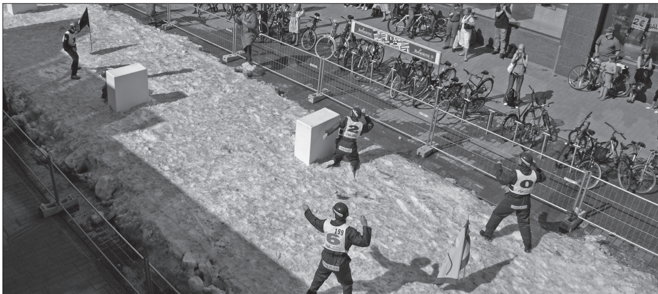
ILLUSTRATION 3 : Démonstration de yukigassen (combat de balles de neige) au cœur de la ville, en juillet, pour promouvoir le tourisme hivernal auprès des touristes estivaux.