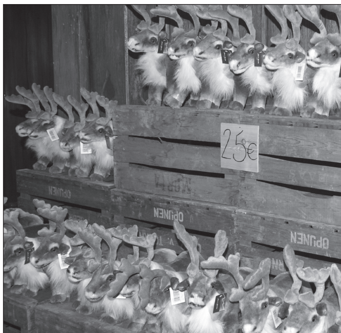
ILLUSTRATION 6 : La faune iconisée des régions polaires (ici, le chien husky et le renne) devient objet à la fois d'appropriation (souvenir) et de promotion.