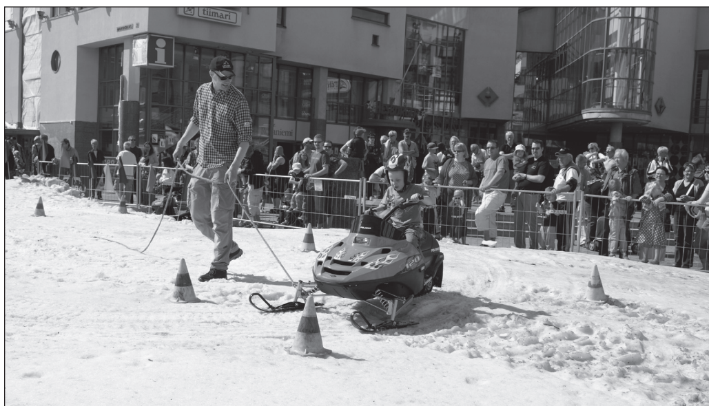
ILLUSTRATION 2 : L'opération « Mad about Santa Claus », en juillet sur le cercle polaire, permet aux visiteurs étrangers de s'initier aux activités de loisir hivernal, comme la motoneige.

formule du circuit. Ainsi organisé, le tourisme polaire se prête à la massification. Celle-ci stimule en retour la diversification des produits touristiques à proximité des centres d'hébergement, comme c'est le cas dans les destinations soleil.