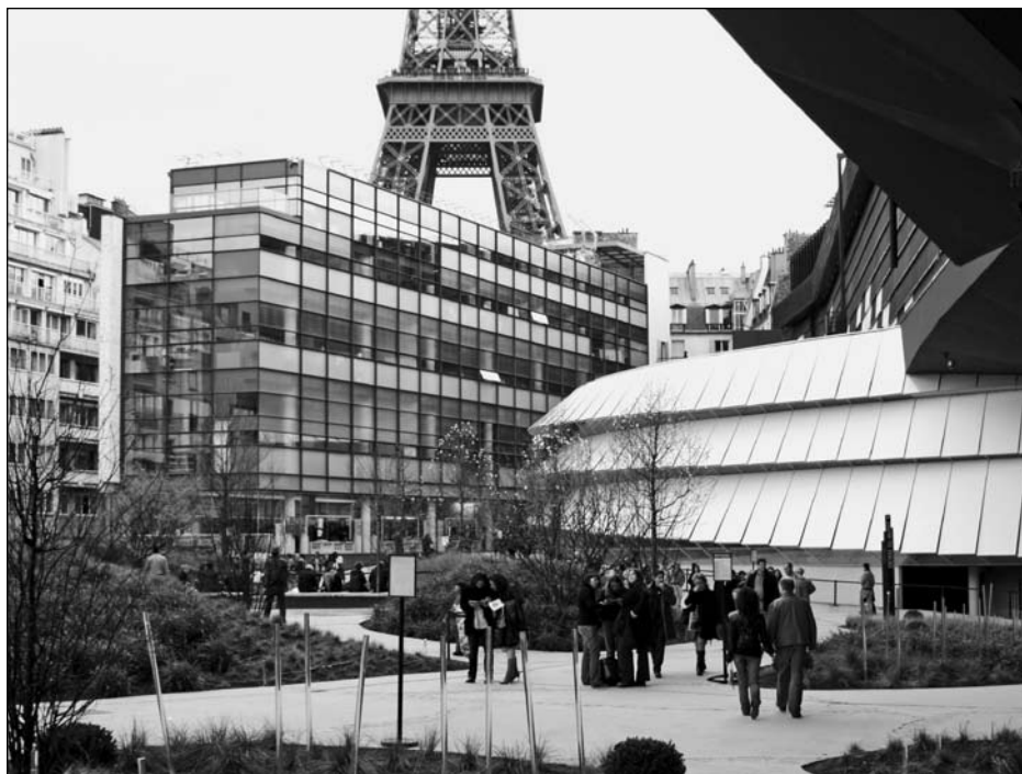
Illustration 3 : Accès au musée du quai Branly.