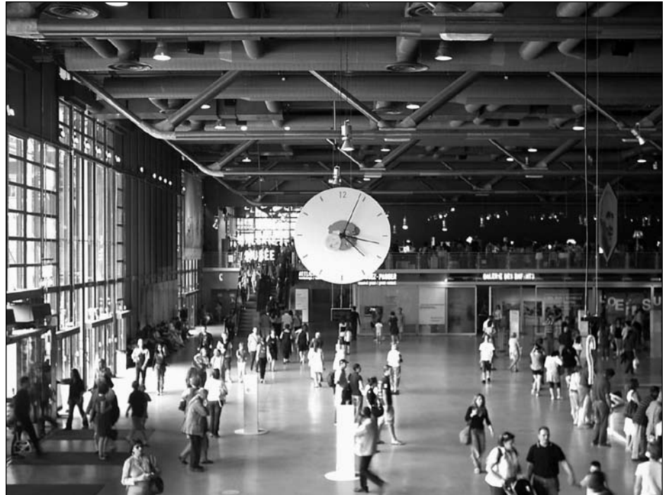
Illustration 2 : Le Forum au Centre Georges Pompidou.

En ce qui concerne sa mission et le public ciblé, le musée du quai Branly s'avère un équipement de recherche à vocation internationale qui associe le monde du musée au monde de la recherche et le chercheur français au chercheur étranger (EPQB, 2008b). Encore une fois, le musée devient essentiellement un espace pour les élites sociales et intellectuelles initiées à la culture et familiarisées avec ces endroits. L'intention de rapprocher la culture d'un large public parisien ne semble pas être un objectif prioritaire pour ce nouvel équipement. Ce musée – comme beaucoup d'autres grands musées de la ville – est destiné aux élites et aux masses du tourisme international. L'implantation au quai Branly, à proximité de la tour Eiffel – visitée par quelques 7 millions de visiteurs chaque année –, met en évidence la vocation touristique du nouveau musée. Le musée du quai Branly s'insère en outre au cœur du Paris des musées qui inclut le musée du Louvre, le musée d'Orsay, le Musée d'art moderne de la