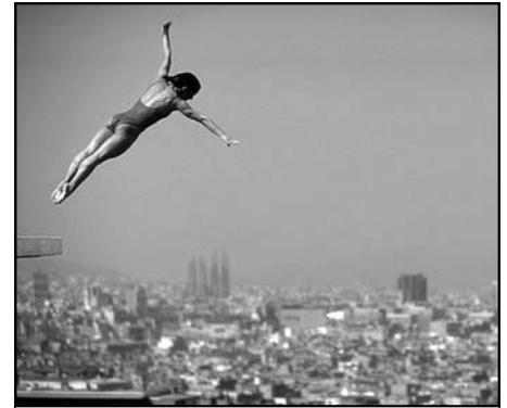
Illustration 2 : Vue d'une plongeuse dans le ciel de Barcelone lors des Jeux Olympiques de 1992.

Le site principal est celui de la colline de Montjuïc, qui fut choisie en 1929 comme lieu de l'exposition universelle et où fut édifié le stade de l'olympiade populaire de 1936. Réhabilité par l'architecte italien Gregotti, ce stade peut recevoir 60 000 personnes pour les cérémonies d'ouverture et de fermeture des jeux. À proximité se situe le palais omnisports de Sant-Jordi, conçu par le Japonais Isozaki. Un large parvis conduit aux portiques néoclassiques proposés par Boffil pour l'université des sports. La piscine, les terrains de hockey et de baseball, les pistes d'entraînement et divers équipements complètent ce vaste ensemble qui est prolongé par le nouveau parc du Midi, comprenant un jardin botanique et un auditorium de 100 000 places. Le deuxième site, celui du village olympique, est l'occasion d'une importante opération de rénovation littorale qui entraîne la destruction d'un quartier ouvrier pour ouvrir la ville sur la mer.