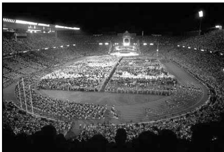
Illustration 3 : Stade olympique des Jeux de Barcelone (1992).