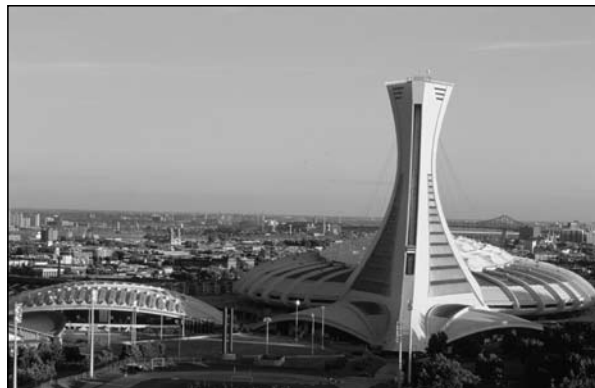
Illustration 1 : Stade olympique de Montréal.

Original sur le plan architectural, le complexe olympique laisse en héritage une dette publique nécessitant plusieurs décennies de remboursement. Il a été dès son origine et reste encore le projet le plus controversé de la ville. Le stade, qui peut accueillir 56 000 personnes assises, a de la difficulté à trouver un tel public et est utilisé pour des concerts de rock, des opéras, des manifestations