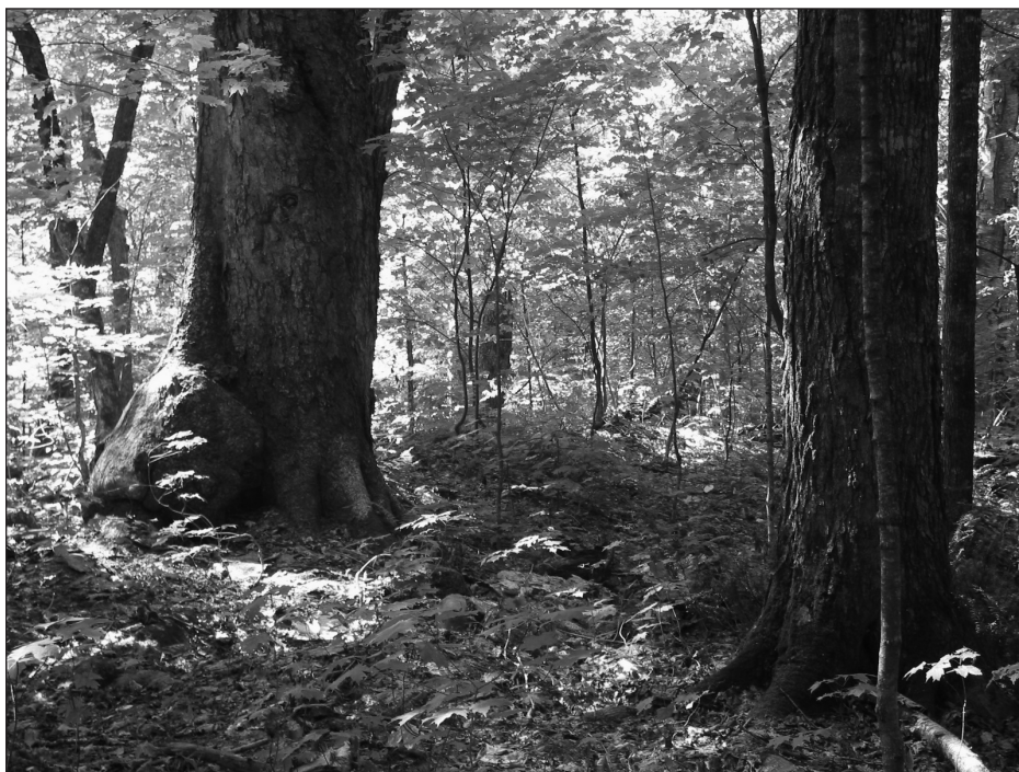
Érablière à bouleau jaune et hêtre ancienne.

À cet effet et dans un souci constant de préservation du milieu naturel, l'Association forestière Québec métropolitain (AFQM), gestionnaire de la mise en valeur et de la sensibilisation au parc municipal de la forêt ancienne du mont Wright, a élaboré une étude de suivi de l'intégrité écologique de ce parc. En effet, l'achalandage de plus en plus important n'est pas sans dommage sur ce milieu naturel. Les activités permises sur le site sont la randonnée pédestre et en raquettes ainsi que la pratique de l'escalade de parois et de blocs. L'objectif de cette étude visait à constituer un état des lieux en regard des impacts liés à la fréquentation par le public et à permettre le suivi, à long terme, de ces mêmes impacts. Pour répondre à cet objectif, l'étude a été divisée en deux grandes parties. La première partie consistait à mener une enquête portant sur les attitudes et les habitudes des usagers du mont Wright afin de mieux connaître le public qui fréquente le parc et la deuxième partie consistait à effectuer des relevés sur le terrain afin de qualifier et de quantifier les impacts de la fréquentation publique.