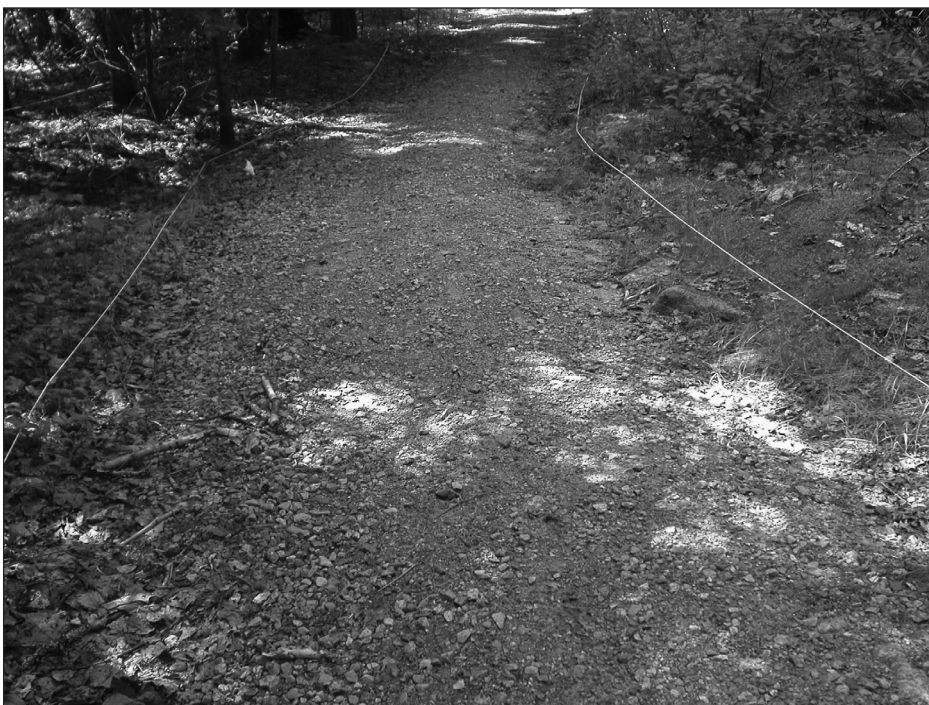
Sentier gravelé avec aucune exposition racinaire.

L'utilisation du carbonate de magnésium et le brossage des parois par les adeptes de l'escalade sont des sujets très controversés chez les grimpeurs. Il serait intéressant de limiter l'utilisation du carbonate de magnésium et du brossage afin de réduire l'impact sur les parois et les blocs. Par ailleurs, à la suite de l'enquête et de commentaires recueillis, l'installation d'une toilette sèche à proximité de la grande paroi d'escalade pourrait réduire le nombre de grimpeurs qui vont effectuer leurs besoins personnels n'importe où en forêt (19 %).