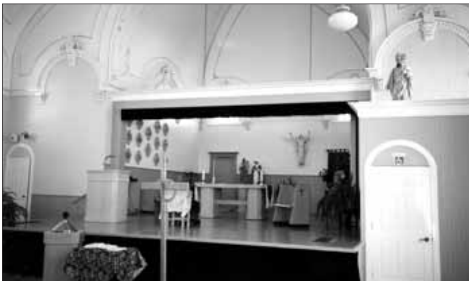
Église Saint-Philéas, Lotbinière.

Appuyant les activités autres que le culte dans des églises, d'autres « ponts » seraient à jeter entre la poétique de l'espace que l'on y expérimente et le principe de réalité. Le philosophe allemand Martin Heidegger (1889-1976) prenait l'exemple du « pont » jeté entre deux rives pour définir un « lieu » et lui conférer toute sa densité 4 . À la lumière de ses travaux, nous pressentons qu'une riche poétique de l'espace devrait permettre de se référer à la métaphore du « pont », c'est-à-dire de pouvoir profiter d'avancées concrètes solidement arrimées