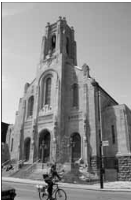
Vue extérieure de l'église Saint-Esprit-de-Rosemont, Montréal.