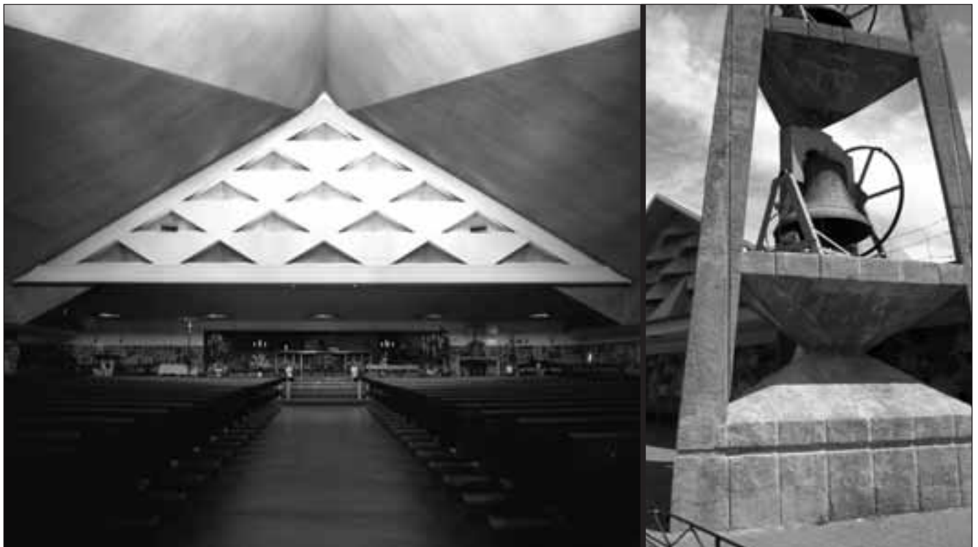
Vue intérieure de la portion centrale et du chœur de l'église Saint-Jean Vianney, Montréal. Ci-contre, son clocher.