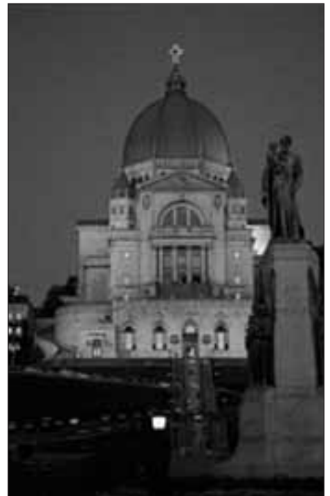
Quatre vues d'églises (carte postale), Montréal, 2000.