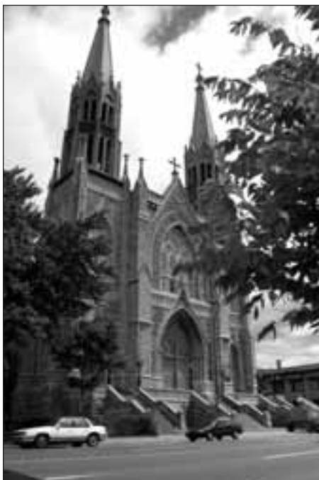
Vue extérieure de l'église Saint-Édouard, Montréal.

S'il est vrai que la mise en tourisme des églises semble être une formule qui a vécu – on a aujourd'hui trop d'églises pour qu'elles puissent toutes être attrayantes