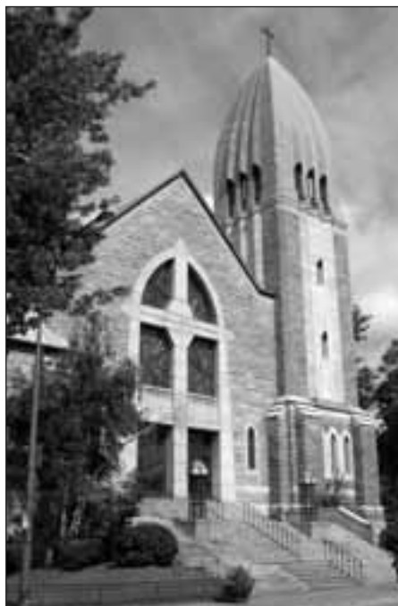
« La Porte vers le ciel ». Vue extérieure de l'église Saint-Arsène, Montréal 22 .