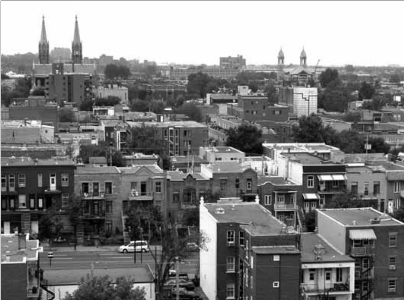
Vue du quartier Petite-Patrie depuis la tour-clocher de l'église Saint-Ambroise. À gauche, l'église Saint-Édouard et à droite, l'église Saint-Jean-de-la-Croix, Montréal.

S'il est évident que les églises qui évoquent la « fondation » de Montréal ou encore celles qui insistent dans le paysage construit pour marquer la présence des « Anglais » et des « Français » – elles sont toutes recensées dans les guides touristiques (tableau 1) – bénéficient déjà d'un statut de protection ou d'une notoriété qui est garante de leur pérennité, il reste à en valoriser un nombre plus grand, précisément au titre du « patrimoine de proximité ». Pour illustrer le potentiel d'une telle démarche, le corpus des églises de l'arrondissement Rosemont–La Petite-Patrie, situé dans le centre-nord de Montréal, nous servira d'étude de cas. Cet arron-