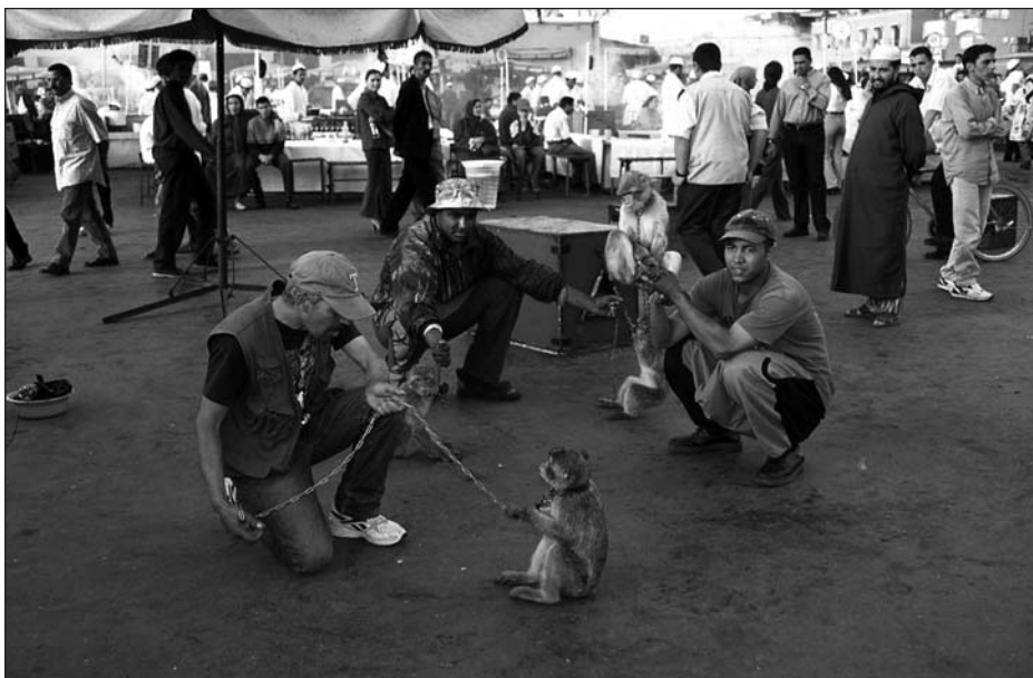
Montreur de singes à la Place Jamaa El Fna, Marrakech (Maroc).

Au-delà des archétypes cultivés par la mémoire collective, il existe sans aucun doute des modèles importés et mal greffés sur le tissu culturel ancestral. L'environnement traditionnel prédispose à la convivialité et au respect de l'Autre ; il pourrait donc se constituer en foyer d'interférences pluriculturelles, si toutefois l'autochtone comme le touriste sont disposés à la rencontre et à l'échange. De plus, les éléments en faveur d'un tel dialogue ne manquent pas, car Marrakech a une longue tradition d'accueil et d'ouverture gravée dans la mémoire et les comportements de ses habitants.