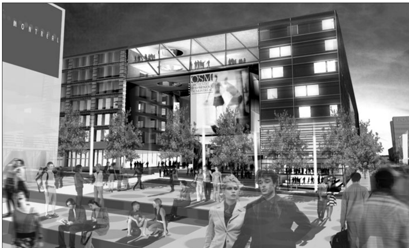
Quartier des spectacles, vue nocturne : « Place des Festivals ». Mise en plan par NOMADE Architecture et Brière, Gilbert + Associés, Architectes.