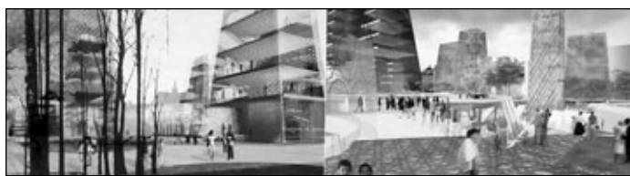
Synthèse du plan d'ensemble du Quartier des spectacles. Mise en plan par NOMADE Architecture et Brière, Gilbert + Associés, Architectes.