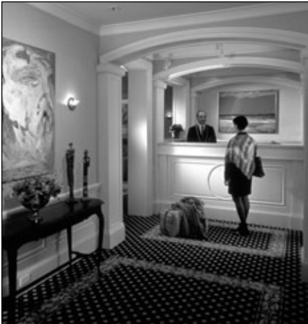
Réception au Château Versailles.