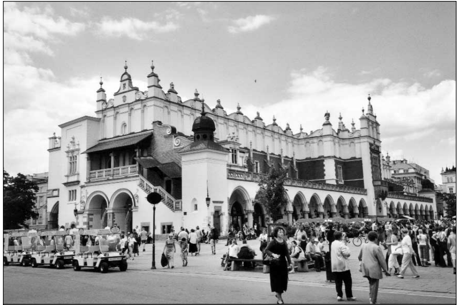
Marché couvert de Cracovie, Pologne.

S'il donnait bonne conscience à plusieurs, le virage qualité pris par l'industrie touristique ne satisfera pas les critiques des excès de cette industrie, loin s'en faut. En particulier, il devenait évident, du tournant des années 1970 aux années 1980, que les répercussions des activités touristiques sur les milieux récepteurs causaient des dommages sévères et parfois irréversibles, des dommages que les retombées, notamment économiques, ne pouvaient compenser. Le phénomène avait déjà été constaté dans le cas des grandes stations de mer et de montagne dont les aménagements avaient bouleversé des environnements fragiles et souvent maintenus à l'écart du développement, jusqu'à leur découverte par des promoteurs et des professionnels du tourisme. Mais, peu à peu, un constat similaire serait fait dans le cas des villes assaillies par les visiteurs de plus en plus nombreux. Bien qu'en apparence moins fragiles que les environnements naturels ou accessoirement humanisés, plusieurs des villes considérées comme des foyers d'art et de culture subissent en effet « une pression touristique considérée, à certaines périodes de pointe, comme insupportable, au-delà de la 'capacité de charge' maximale : Florence et Venise, Grenade, Athènes, Évora, Bruges, Amsterdam, Salsbourg, Prague, Bath... » (Cazes et Lanquar, 2000 : 115).