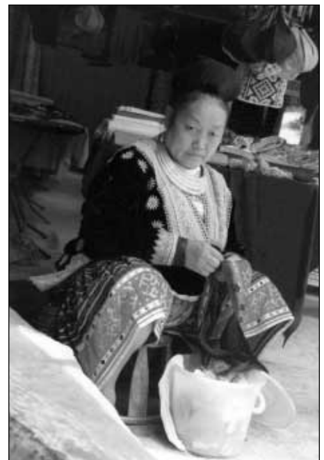
Femme de la tribu Hmong au nord de la Thaïlande.

L'adoption, en 1999, d'un Code mondial d'éthique du tourisme par l'Assemblée générale de l'Organisation mondiale du tourisme (OMT) s'est inscrite en quelque sorte dans le sillage de tels positionnements critiques. Le code affirme « le droit au tourisme et à la liberté des déplacements touristiques [...] la volonté de promouvoir un ordre touristique mondial équitable, responsable et durable, dans un contexte d'économie internationale ouverte et libéralisée » (OMT, 1999a et 1999b). Depuis l'adoption de ce code, plusieurs organismes, associations et entreprises ont emboîté le pas. Cette éthique du tourisme ne vise manifestement pas à modifier radicalement les règles du jeu ; tout au plus cherche-t-elle à contenir les débordements, les excès, les dérives et les impacts négatifs. Pour l'essentiel, le tourisme soumis à cette éthique reste en effet