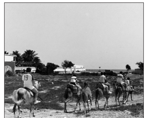
Port El Kantaoui, Tunisie.

Plusieurs motivations combinées se retrouvent dans la décision des étudiantes de voyager en Tunisie : la participation à