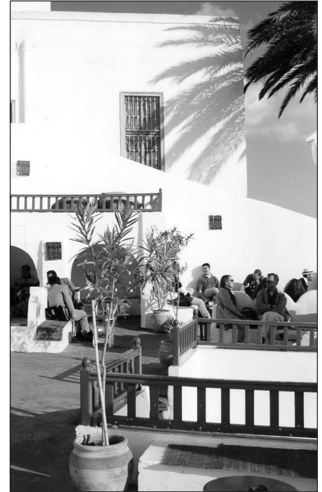
Touristes occidentaux à Sidi Bou Saïd, Tunisie.