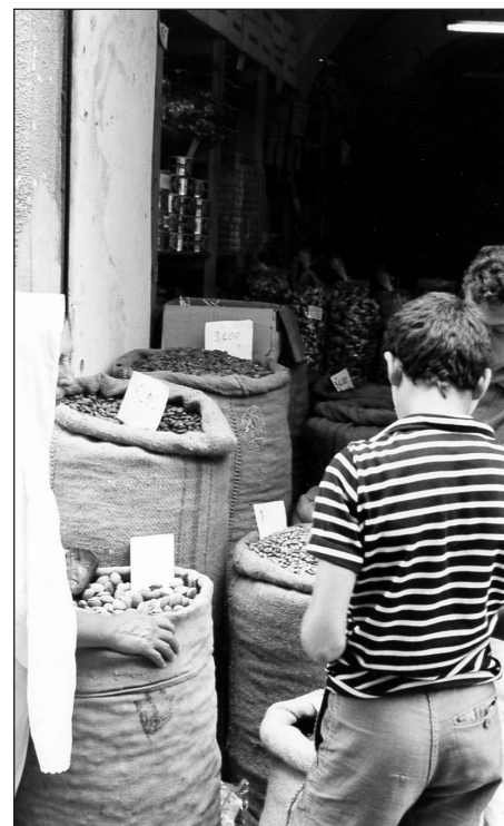
Les souks de Monastir, Tunisie.

Parce que ce qui est drôle c'est que dans les rues, dans les endroits publics, les femmes sont cachées ; elles ont l'air d'être assez pudiques, puis nous on est toutes dévoilées. Puis, au bain, c'est nous qui nous cachions, qui étions gênées alors qu'elles n'avaient pas de problèmes avec la nudité. Finalement c'est nous qui avons l'air le plus fou !