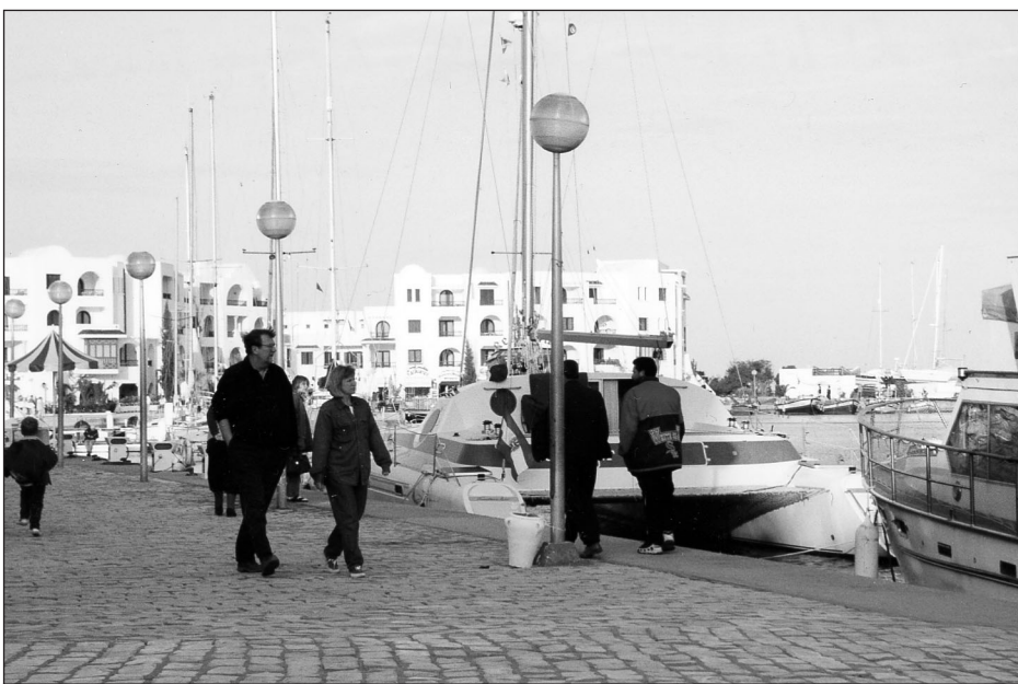
Port El Kantaoui, Tunisie.

Presque toutes les étudiantes étaient d'accord pour dire que l'habillement a joué un rôle dans les réactions et les attitudes des hommes envers elles. Les questions du regard et de la proximité physique constituent un thème saillant dans les entrevues de toutes les étudiantes et leur importance varie en fonction des catégories d'hommes rencontrés, soit dans des cadres formels, des contextes touristiques anonymes ou lors de relations plus intimes. Dans le cadre des relations sociales associées au congrès, où se trouvaient des Occidentaux et des Tunisiens occidentalisés, le type d'interactions obéissait aux critères