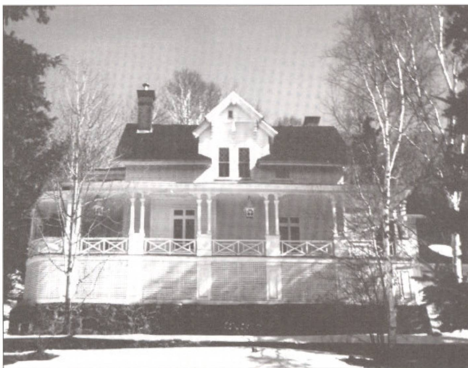
Résidence secondaire au lac des Sables, Sainte-Agathe-des-Monts.

Les résidences secondaires érigées à Sainte-Agathe-des-Monts incarnent, plus que partout ailleurs dans les Laurentides, cette poussée de villégiature qui accompagne le déploiement du réseau ferroviaire dans le dernier quart du XIXe siècle. L'élite industrielle, financière et politique se construit, ici comme en d'autres lieux réputés pour leurs attraits naturels 2 , de vastes demeures d'une architecture éclectique de style néo-Queen Anne, néo-gothique, Regency, vernaculaire ou rustique (notamment les log houses 3 ).