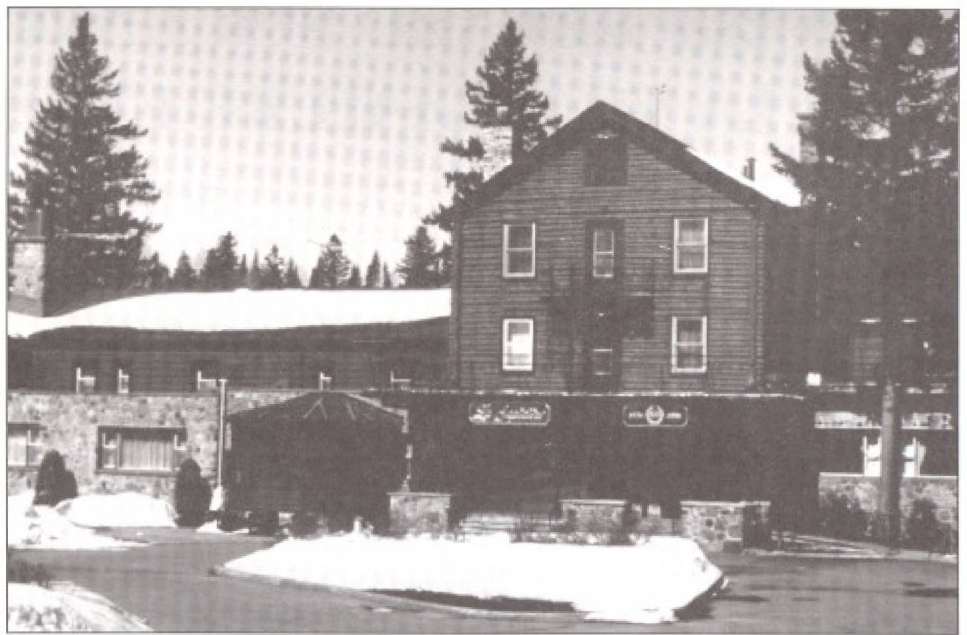
La Sapinière. Le corps central du bâtiment témoigne de l'architecture rustique des années 1930.

Le Nymark's Lodge de Saint-Sauveur (incendié à la fin des années 1970), l'Alpine Inn de Sainte-Marguerite-du-lac-Masson, la Sapinière de Val-David et le Château Montebello (Lucerne-In-Quebec Seignior Club house) témoignent égale-