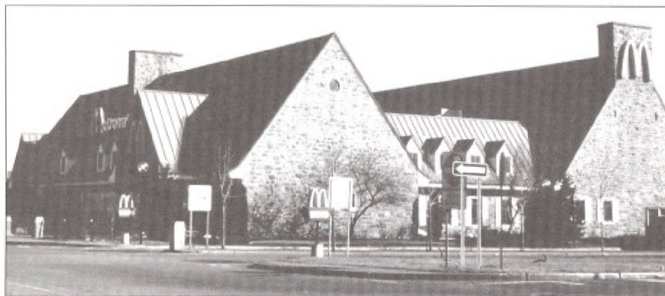
La Porte du Nord. La référence au passé du Québec demeure une constante.

Les décennies 1950, 1960 et 1970 seront marquées par un développement sans précédent de la villégiature. Les fonds des vallées et les versants des collines se couvriront de chalets et, de plus en plus, de résidences secondaires fréquentées à longueur d'année. Les courants néoquébécois et d'inspiration alpine domineront les deux dernières décennies de cette période. Le chalet alpin, caractérisé par son mur pignon abondamment fenestré et ses vastes galeries abritées par le débord de la toiture, sera privilégié dans le cas des versants. Quant à la maison dite québécoise, dont le carré de pièce ou de pierre est coiffé d'une toiture à larmiers percée de lucarnes, elle sera préférée dans les creux et aux abords des villages. La halte la Porte-du-Nord incarnera également ce courant en transposant dans les Basses-Laurentides une volumétrie s'inspirant de l'architecture de pierre de la vallée du Saint-Laurent.