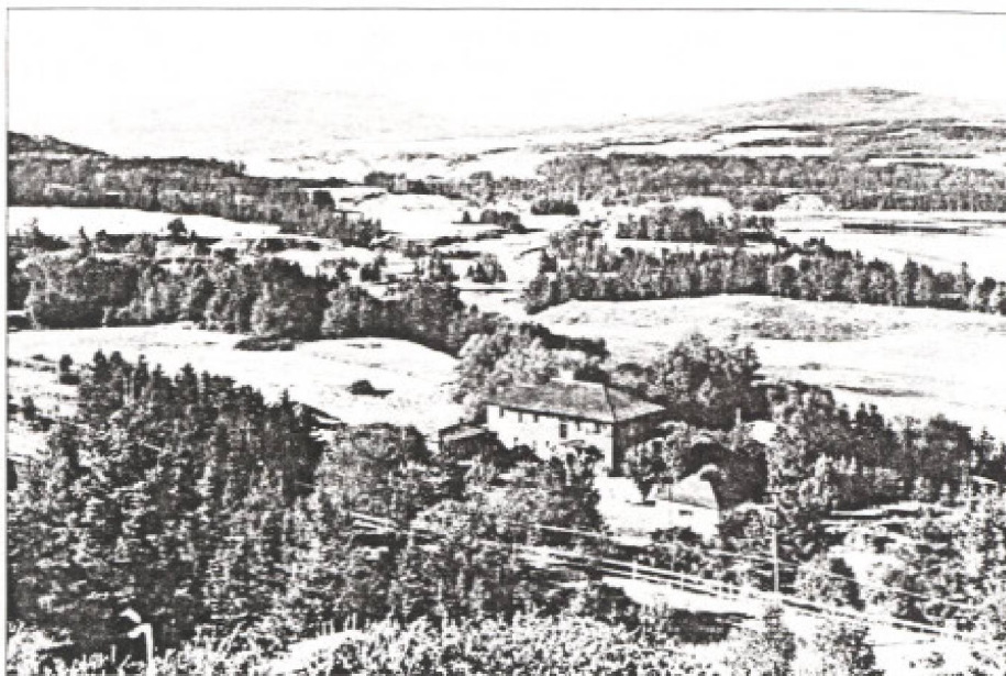
La force du panorama. Nulle théorie ne peut prétendre qu'elle sait, suivant des principes savants, mettre en relation l'architecture au paysage. Seule une volonté très nette d'«empayement» fait qu'une villa ou un jardin se marie à ce beau pays dans une union durable devant l'éternité. Photo: Miss Louise Crane, collection privée, photographie de «Associated Screen News» Ltd, Montréal, CSL175-1, CSL175-2.

Pour le touriste, la villégiature représente la fin de l'errance et l'architecture de villégiature devient alors l'expression hyperbolique de son établissement au pays des vacances. Au fil des ans, ce symbole dans l'espace prend différentes formes que nous avons voulu regrouper en quatre (4) types, correspondant chacun à quatre temps consécutifs étalés sur une histoire longue de plus d'un siècle et demi. Cette séquence temporelle s'est imposée à nous alors que