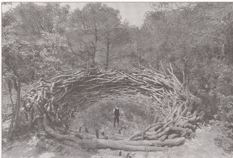
Le nid, Culture-Nature... la niche écologique universelle. Sculpture monumentale réalisée en France, dans le prolongement des écoles de pensée, anglo-américaines, reliées au Earth works , Land art et à celle de la collaboration with nature . Les forêts domaniales et autres, devenues récréotouristiques, et jusqu'ici jardinées par l'entretien des sous-bois, nécessitent dorénavant — pour être plus humanisées — une nouvelle approche relevant de l'art environnemental. Ce qui octroie une plus value à la nature. Ce dont la nature brute des parcs et réserves actuels devrait être dotée pour entrer de plein pied dans le 3 ème millénaire — et ainsi — devenir plus performante, culturelle et attractive vis-à-vis d'une population de plus en plus urbanisée.

C'est alors que naquit, à partir d'un constat réel et objectif mais, limité dans l'espace et le temps, la volonté de protéger la faune, la flore et le milieu abiotique, que l'on déclara en danger, après les avoir considéré eux-mêmes dangereux pendant des millénaires. Etrange retournement des perceptions!