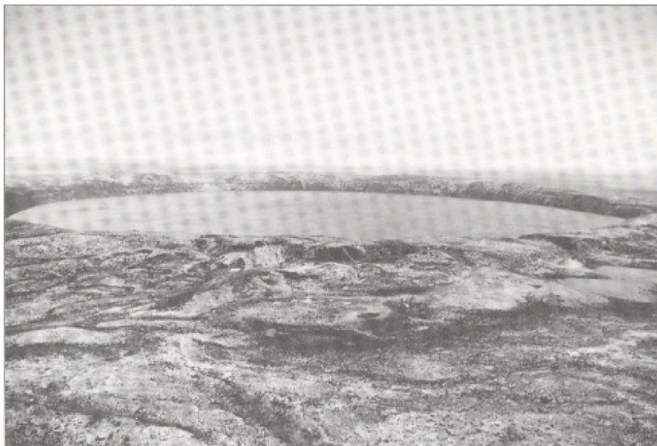
Le cratère. Le cratère du Nunavik redécouvert par un Américain, en 1943 et son lac de cristal, sont uniques au monde. De plus, à 90 kilomètres environ, sur l'île solitaire de Qikertaaluq, se trouvent les seuls pétroglyphes inuit connus, à quelques kilomètres du village de Kangipsujuaq. Nouvelle synthèse à construire entre les écologies et l'art primitif.

Le tourisme d'aventure que l'on place très souvent dans le passé naturel se situerait plutôt dans un futur culturel recomposé au sein de grands espaces exceptionnels. Quant aux clientèles, celles-ci auraient aussi des attentes particulières reposant a priori sur leur