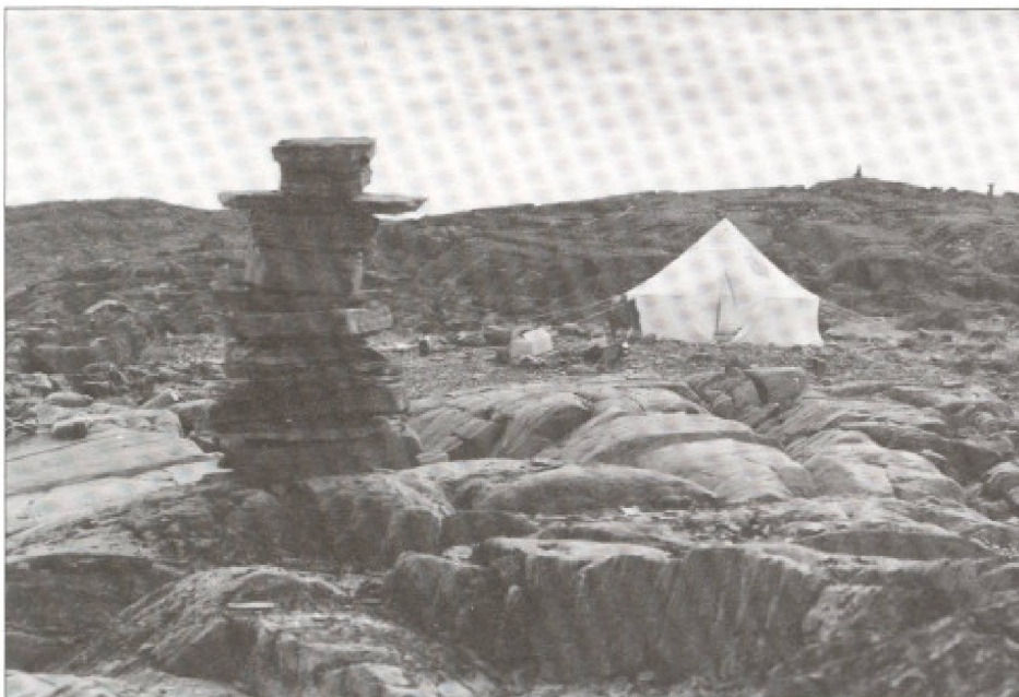
Les statues. Les Inukshuit, sorte de sculptures inuit ayant une utilité directionnelle, symbolique et magique, sont les seuls monuments nordiques. Dans un contexte futurogène, ils devraient être intégrés au redéveloppement du tourisme d'aventure de cette région, créer des emplois de «construction» et redevenir des attraits centraux dans le grand-espace de la toundra.

L'Aventure avec un seul A, est un acte de vie principalement culturel et temporairement vécu au sein des grands espaces naturels et évocateurs que la terre a su conserver au regard de l'homme des années 2000. Pour s'y plonger, le touriste aventurier n'a plus besoin de sacrifier son confort, sa sécurité, ni de négliger son alimentation. Bien au contraire, les progrès techniques et scientifiques lui permettent déjà - à l'aube du troisième millénaire - d'expérimenter à un âge avancé - des moments intenses, dans des milieux isolés, là où jusqu'à présent, seuls des jeunes gens se risquaient à l'aventure.