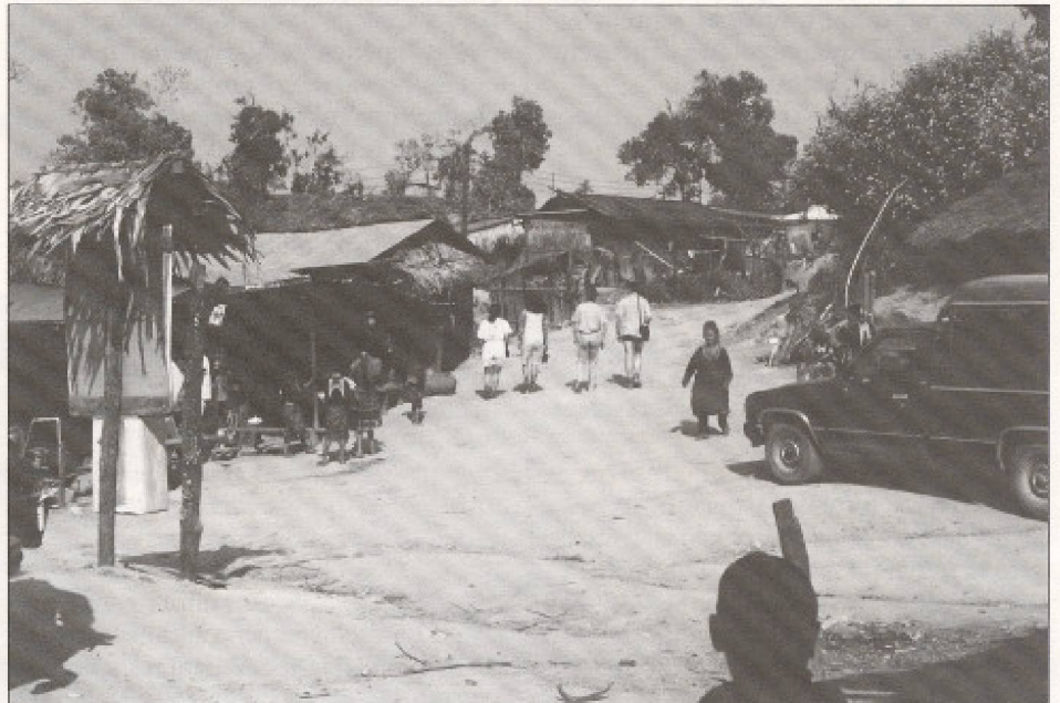
Touristes quittant leur véhicule pour visiter à pied un village du groupe Hmong dans la province de Chiang-Mai.

Dans les trois cas cités plus haut, et dans d'autres encore, une attraction occupe une place de choix dans la publicité faite à l'endroit des visiteurs étrangers, une place hors de proportion avec la faible importance démographique des populations faisant l'objet de cette promotion. Il s'agit des populations qu'on dit tribales. Exotisme fortement teinté de primitivisme, traditions vestimentaires distinctes, vivantes et colorées, isolement dans les lieux reculés des périphéries nationales garant d'authenticité culturelle, toutes ces caractéristiques qui servent dans la publicité touristique à décrire ces minorités sud-est