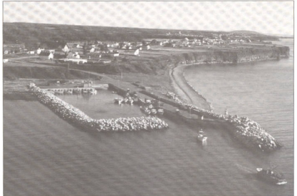
Le port de pêche de Saint-Godefroi. Une remarquable infrastructure portuaire doublée d'une plage et d'une falaise roses qui sont largement sous-utilisées au plan récréotouristique.

Jean-Claude Jay-Rayon en collaboration avec Brigitte Morneau*