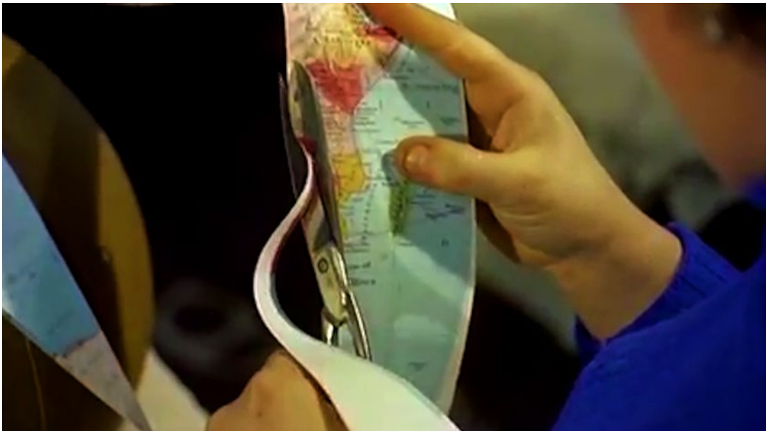
Figures 3 et 4 : Nicolas Premier, AFRICA IS THE FUTURE © 2020. Photographie de film. Avec l'aimable autorisation de l'artiste.