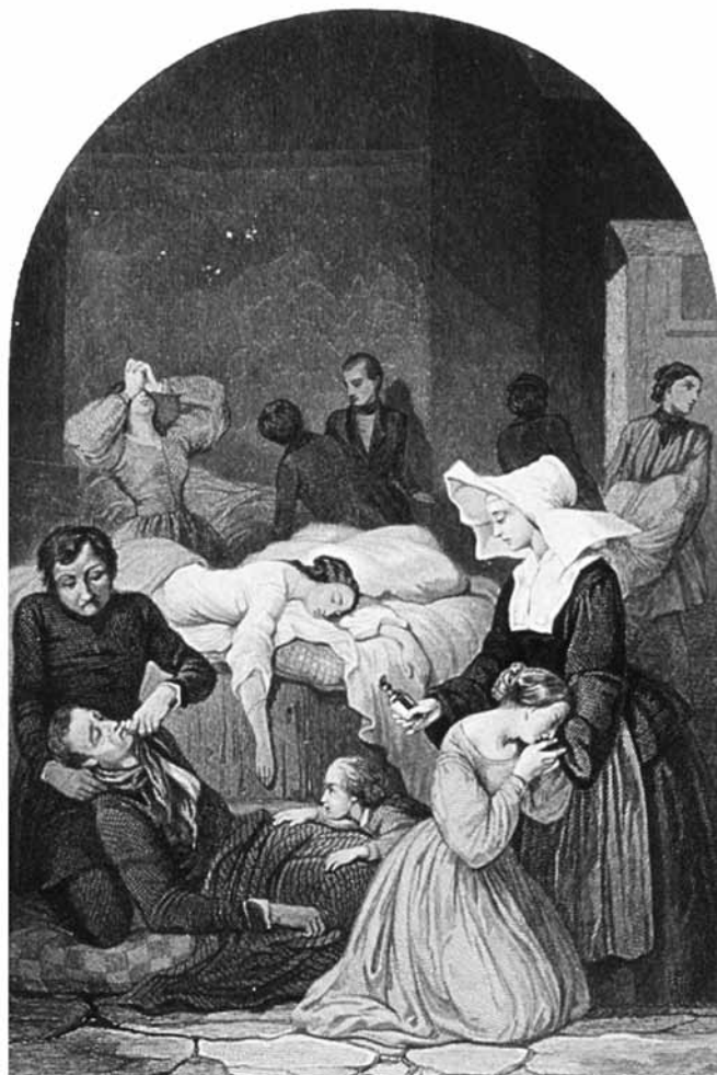
Figure 3. J. Roze, Le choléra à Paris , après 1832, gravure, 26 x 18 cm, Bethesda, MD, The National Library of Medicine (Photo : Images from the History of Medicine).

figures du peuple. La métaphore olfactive permettait aux critiques d'aborder la peinture réaliste en termes de réaction physiologique, le dégoût et la nausée étant des réflexes impérieux et strictement corporels provoqués par l'intrusion et la proximité dont s'accompagne l'olfaction 48 , sens propice à l'évocation métonymique (fig. 2).