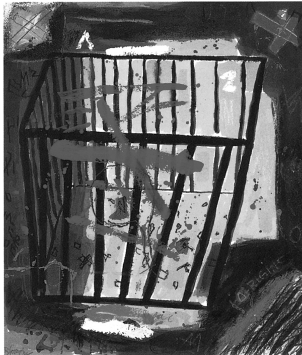
Robert Fortin, Origine, acrylique sur papier Arches, 1993. Éditions Pite de parole, Sudbury.

met la colère, le refus (les traits forment un « X »). Rappel du sang contaminé, qui en plus de la vie porte maintenant l'agonie, ce rouge masque aussi l'absence du corps dans la cage. Nous sommes sensibles à cette prison, car elle reflète l'amertume qui ressort de ce premier recueil de poèmes :