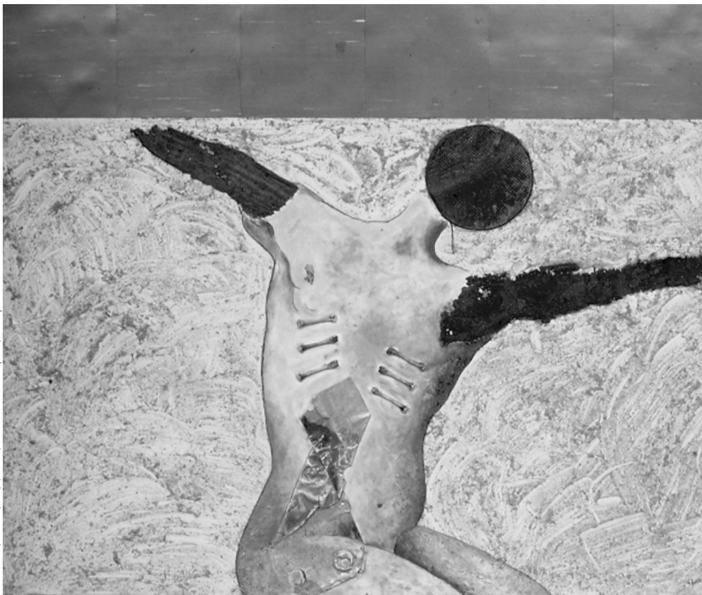
Robert Fortin, Sans titre , m/m, 1,52 sur 1,83 m. Éditions Prise de parole, Sudbury.

recommencer sans honte la faute originelle des certitudes réchauffent mon lit mon sexe affirme la résurrection de la chair (Fortin, 1995, p. 29)